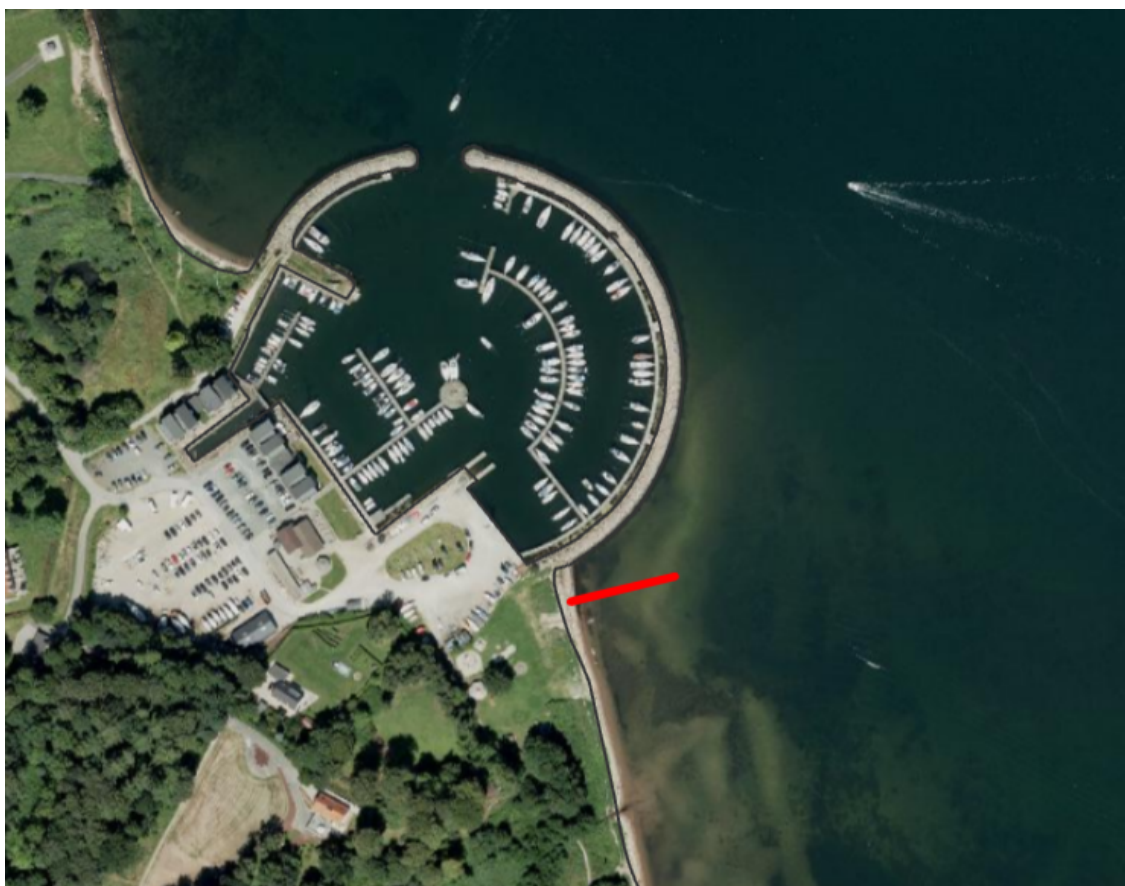
Figur 1. Ca. placering af broen er markeret med en rød streg ved siden af Brejning Havn.