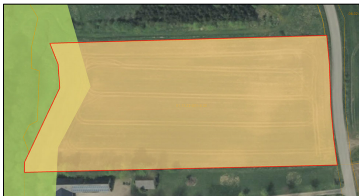
Kort over matrikel (orange), hvor der på markarealet skal rejses skov, samt naturområde (grøn)

I den vestlige ende af markarealet, hvorpå der skal rejses skov, ligger en udpegning af naturområde. Af kommuneplanen fremgår det, at naturområder omfatter områder, som er beskyttede efter naturbeskyttelseslovens § 3, såsom moser, enge, overdrev, heder, strandenge, søer og nogle vandløb samt områder, som er omfattet af fredskov jf. skovlovens bestemmelser. Endvidere indgår øvrige områder, som vurderes som vigtige naturarealer. Denne udpegning inden for matriklen er ikke omfattet af en naturbeskyttelse. Dog løber Mølbæk, et beskyttet vandløb, ca. 7 meter fra matrikelgrænsen af mod vest, og som udløser udpegningen af naturområde. Det er kommunens vurdering, at skovrejsningen ikke er i strid med udpegningen, da der rejses skov på et areal, som for nuværende er en mark i omdrift. Ligeledes er der et beplantningsbælte langs den vestlige del af matriklen, som adskiller vandløbsområde og markarealet. Skovrejsning på markarealet vil derfor ikke få en negativ indvirkning på det beskyttede vandløb.