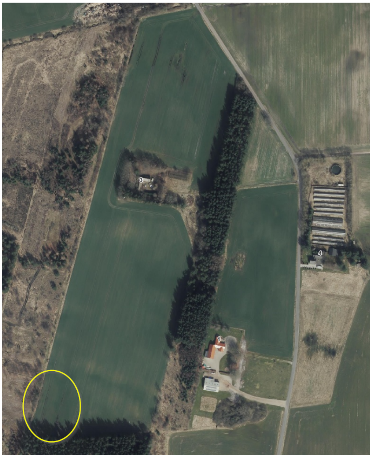
Luffoto af matrikel 36d fra foråret 2021. Området der er udpeget som særlig værdifuld natur er vist med gul cirkel. I 2021 var området under landbrugsmæssig drift.