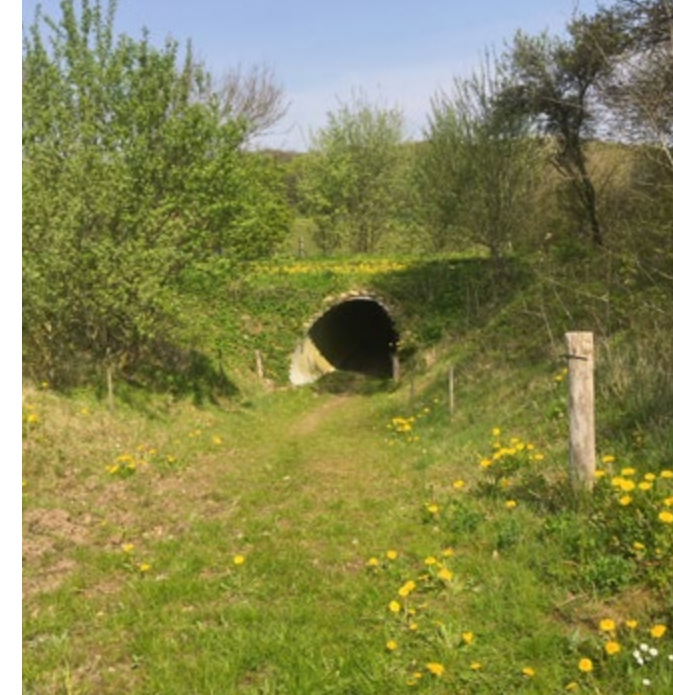
På vej rundt om Fårup Sø.

Fårupgård Hovedgårdens historie kan føres tilbage til 1400-tallet. Efter århundreders skiftende ejere og slægter endte hovedgårdsjorden i 1911 som 26 husmandsbrug. Hovedgården er i dag ramme om Fårupgård Ungecenter - et sted med tilbud til unge med særlige behov.