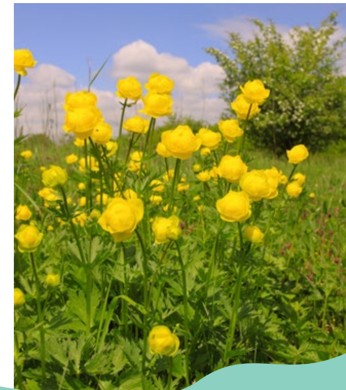
Engblomme vokser enkelte steder i Grejs Ådal.