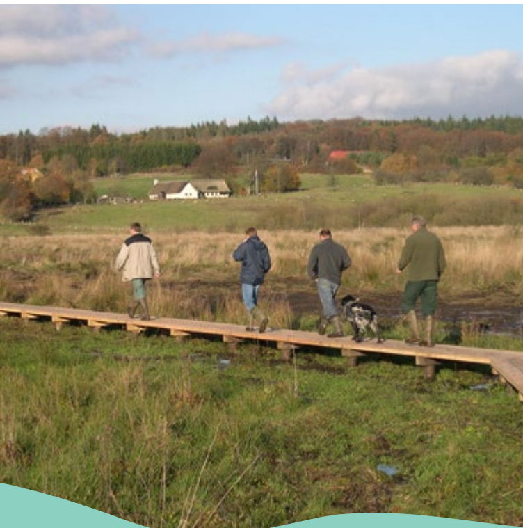
Der er flere steder hjælp til at komme tørskoet rundt.