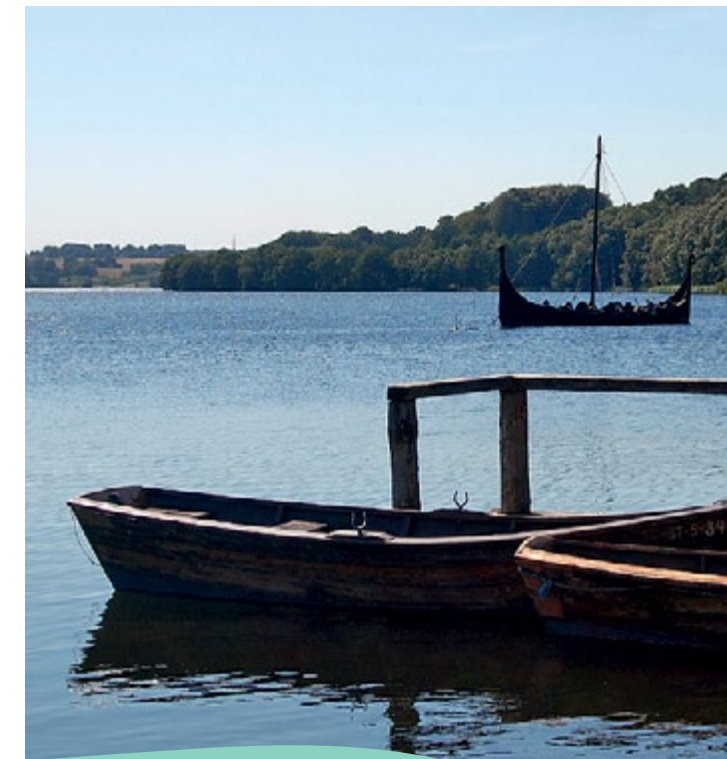
Bådebro og det gamle vikingeskib ved Fårup Sø.