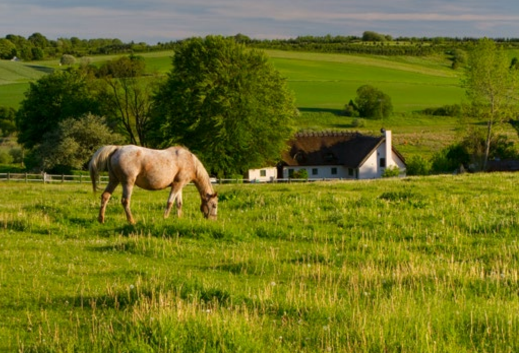
Udsigt til Grejs Ådal.