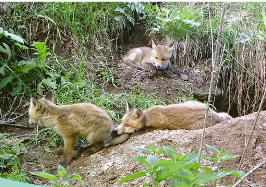
Der er grævlinge- og rævegrave i området. (Taget med overvågningskamera).