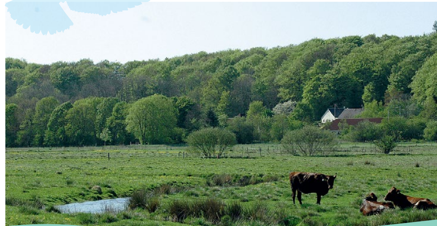
Grejs Ådal ved Skovdallund.