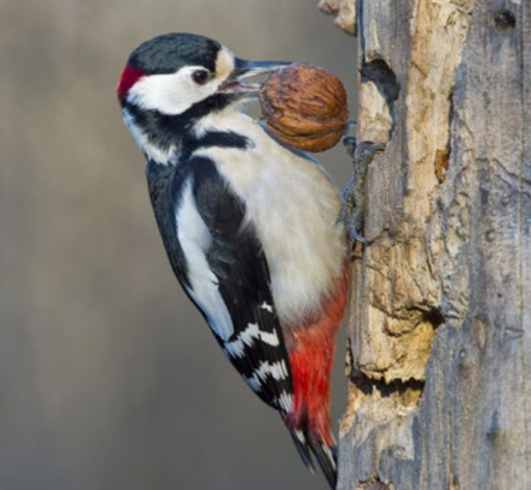
Stor flagspætte er almindelig i skoven.