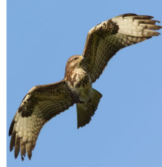
Musvåger svæver tit elegant over ådalen.