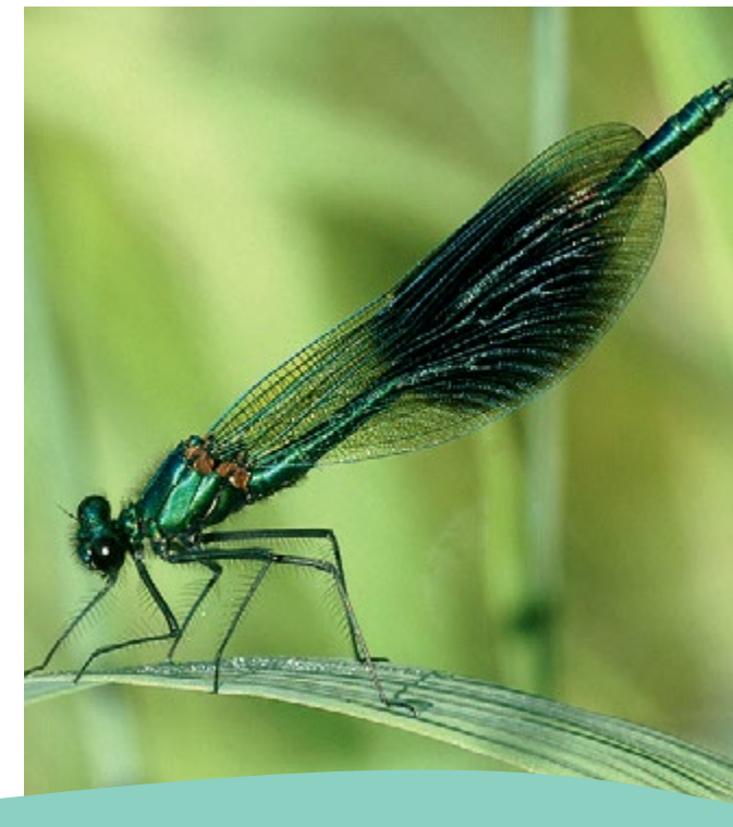
Vandpragtnymfen er almindelig langs åen.