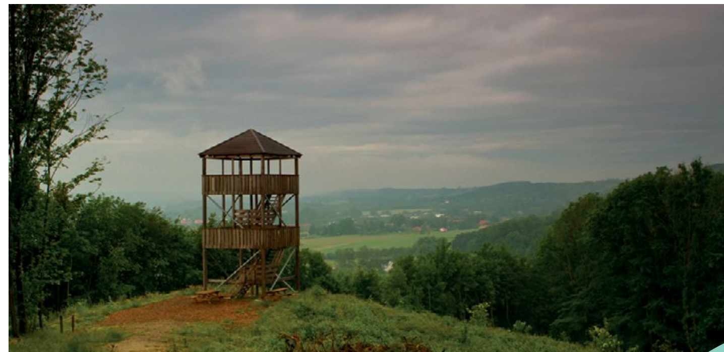
Udsigtstårn ved Østengård.

og ikke mindst Vejles første zoo, der skulle blive forløber for Givskud Zoo, lå dengang ved Himmelpind.