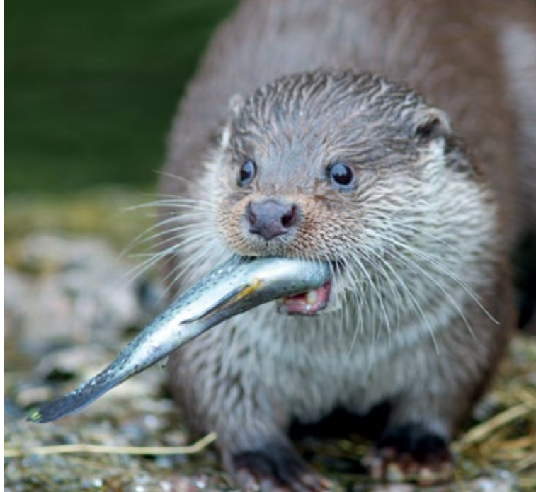
Odderen er vendt tilbage til ådalen efter genslyngningen af åen.

Det er med til at skabe en større biodiversitet. Samtidig skyder ny kommuneskov op på bakkerne syd for Haraldskær.