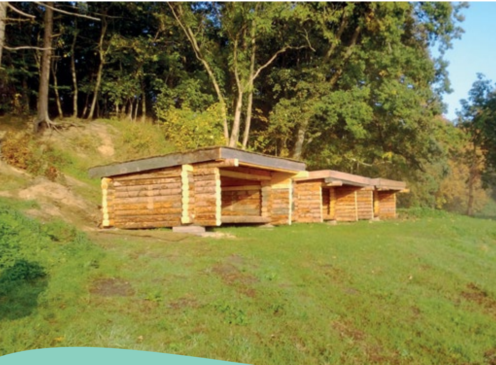
Ved Kvak Mølle er der en telt- og shelterplads med båhytte og toilet.