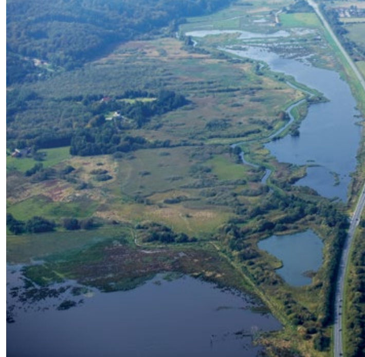
Kongens Kær og Knabberup Sø set fra oven.