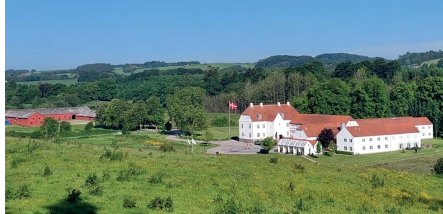
Haraldskær herregård fra ca. 1590 med de røde avlsbygninger i baggrunden