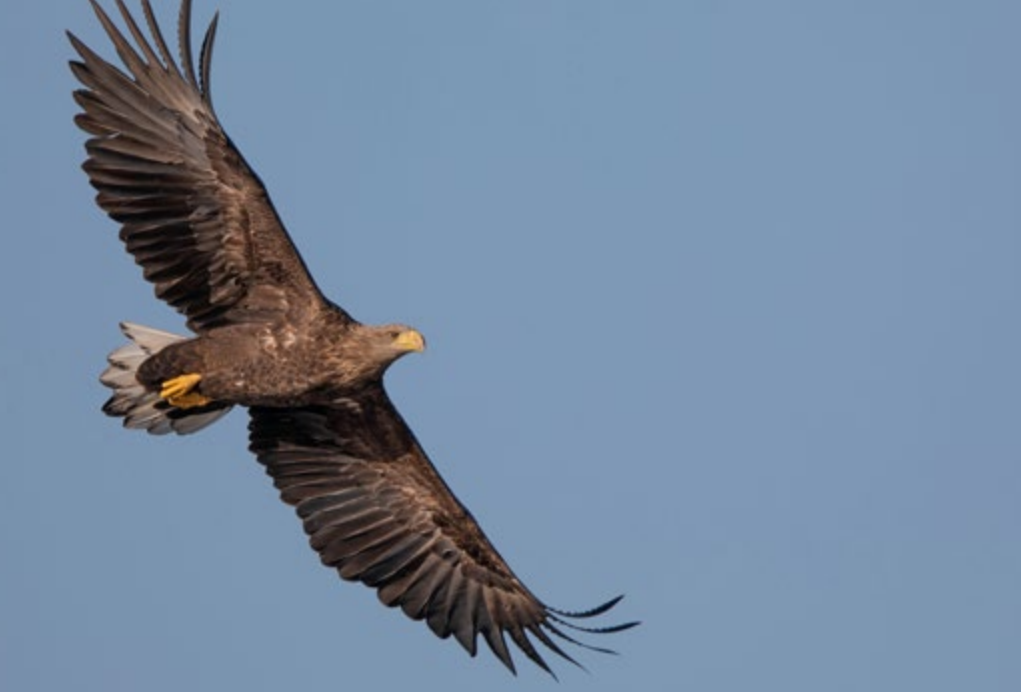
Du kan se havørne ved Kongens Kær.