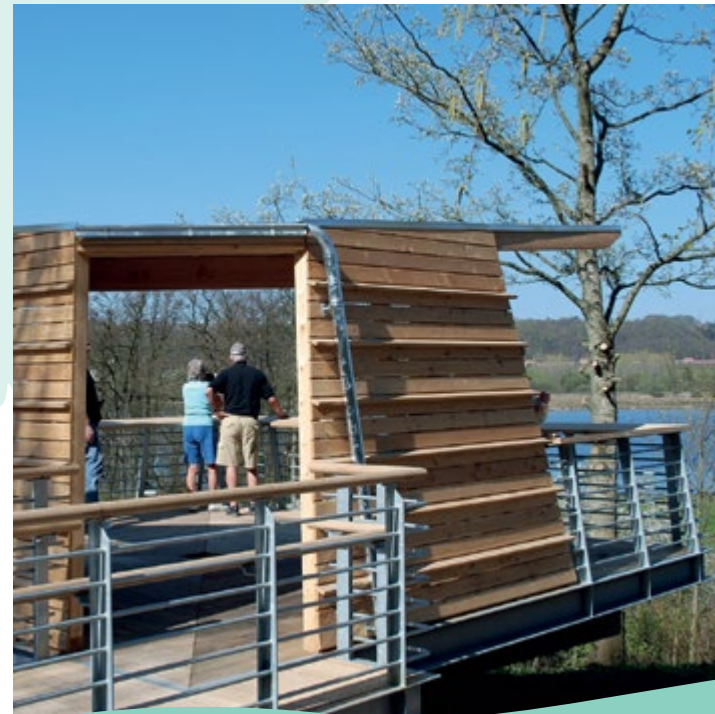
Udsigtsplatform ved Kongens Kær.

Der var liv og glade dage på Himmelpind i midten af 1900-tallet. En af landets mest populære kroer, Trædballehus, en lysthave