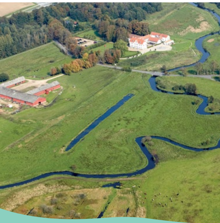
En del af den genslyngede å ved Haraldskær. I de røde avlsbygninger finder du en stor, gratis udstilling om hele Vejle Ådal og Fjord området.

Et stykke af kanalen ligger tilbage som en aftang sø, som et minde om