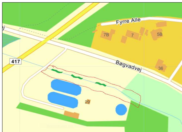
Projektstrækning i Egtved Å ved renseanlægget.

Bliver Projektet ikke færdigt under det planlagte kursus, etabler Vejle Sportsfiskerforening resten, således at projektet er færdigt i efteråret 2025.