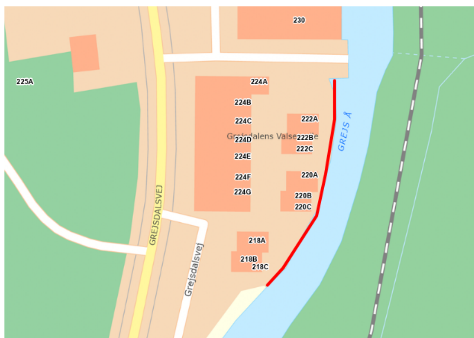
Figur 1: Oversigtskort. Der etableres brinksikring på strækningen markeret med rød streg.

Ansøgningen har været i offentlig høring i 4 uger. Vejle Kommune har ikke modtaget skriftlige høringssvar i perioden.