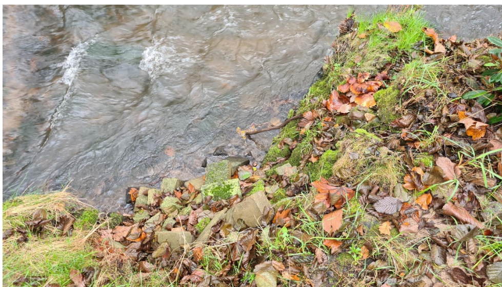
Figur 3: Gammel brinksikring ved Kammasvej 4.