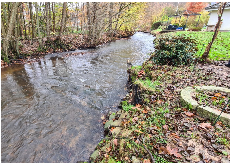
Figur 2: Grejs Å set i nedstrøms retning ved Kammasvej 4.