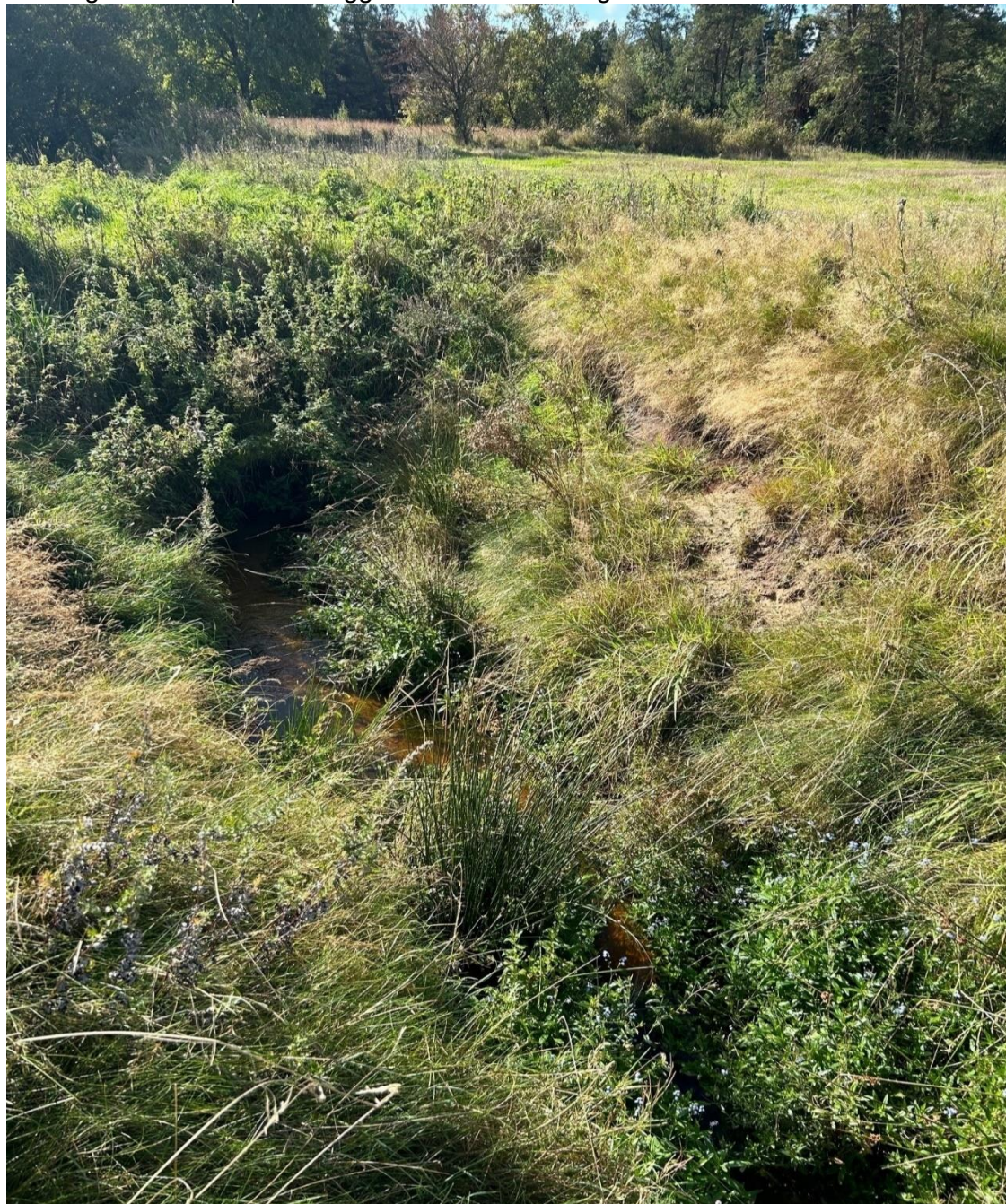
Billede 2. Nedskredne brinker

I nedstrøms ende af strækningen er der en røroverkørsel. Opstrøms for overkørslen bærer vandløbet præg af at der ofte er foretaget oprensning. Den faste vandløbsbund, er ca. 0,5 meter lavere en bunden af røret. Fra røret og ca. 10 m opstrøms ligger der en stor mængde sand.