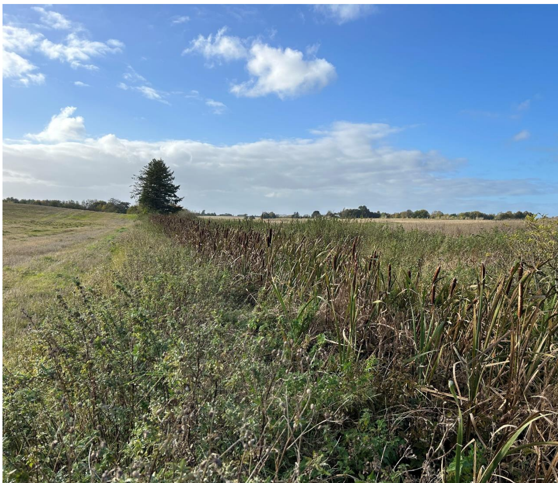
Billede 3. Strækning 2 tilgroet i dunhammer.

Der er meget lidt fysisk variation på strækningen og floraen på strækningen er meget ensartet hovedsagligt bestående af dunhammer, lådden dueurt og grenet pindsvineknop.