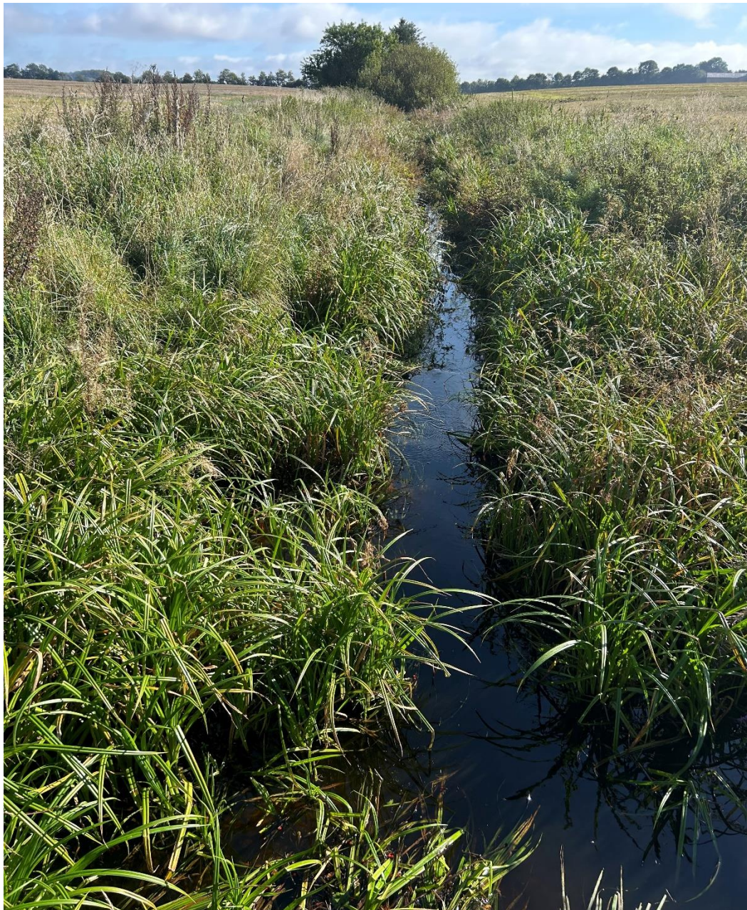
Billede 1. Vandløbsstrækning 1. Dybt skåret vandløb med stejlt brinkanlæg.

Strækning 1 er 175 meter lang. Vandløbet er et forholdsvis smalt vandløb med en bundbrede der varierer mellem 0,5 og 0,75 meter. Vandløbet ligger dybt nedskåret i terrænet, med stejle brinker. Skråningsanlægget er anlæg 1:1 og afstanden fra bunden til kronekant på mellem 1,7 til 2 meter. På store dele af strækningen er der tydelige nedskridninger og erosionsskader på brinkanlægget.