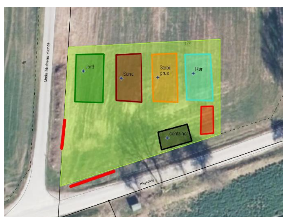
Figur 3: Indretning af området