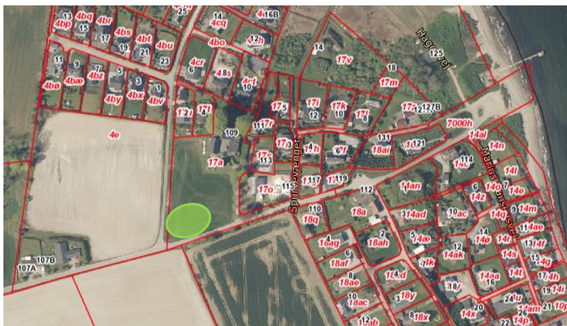
Figur 1: Placering af midlertidig arbejdsplads i Mørkholt