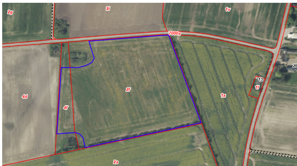
Figur 1. Oversigtskort med blå markering af afgrænsningen af det anmeldte skovrejsningsareal. Røde linjer er matrikelgrænser.

Figur 1 viser et oversigtskort over det anmeldte skovrejsningsareal.