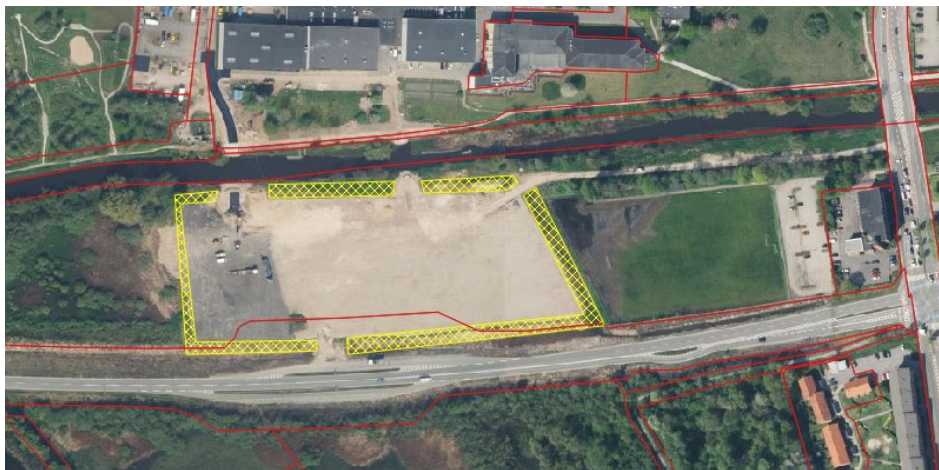
Figur 2 - Oversigtskort, areal til indbygning på matrikel 166c Engene, Vejle Jorder

Materialet blandes yderligere med muld under indbygningen, hvorefter arealet afslutningsvist beplantes med træer.