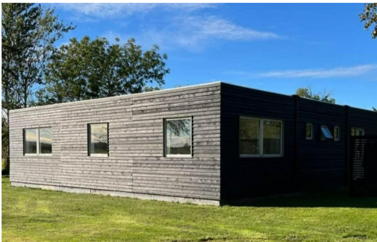
Figur 2 Billede af pavillonen