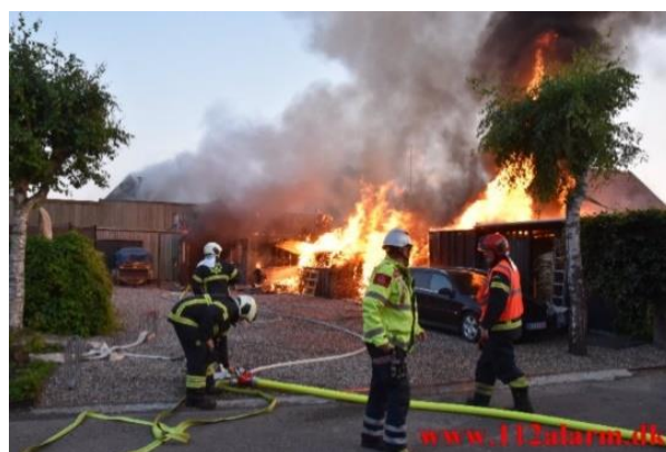
Brand i værksted og beboelse i Gravens

Indsatsen krævede indsættelse af stationerne i Egtved, Kolding, Vejle med to slukningsenheder og Beredskabsstyrelsen. En indsats der tidsmæssigt tog 16 timer før brandvæsenet og Beredskabsstyrelsen kunne forlade stedet. Samlet set kostede branden Vejle Brandvæsen 75.000 kr. i lønninger til brandmandskab og indkaldt personel til dækning af Vejle by samt tabt og ødelagt materiel.