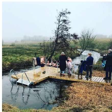
Danmarks første vinteråbad i Farre, støtte til aktive borgere og foreningen "De kolde laks"