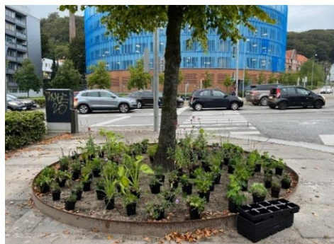
Nye stauder Skovgade – Horsensvej, Vejle