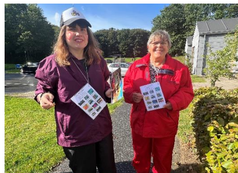
To glade deltagere til årets Landkrabbefestival på Postens Vej.