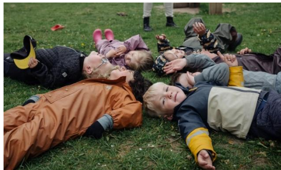
Børnehaven Trip Trap Træsko