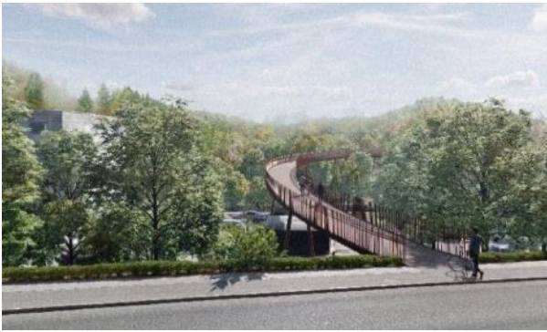
Stibro ved Grejsdalsvej

Den nye stibro der forbinder Grejsdalsvej og skoven ved Store Grundet Skovvej hen over jernbanen blev indviet den 6. juli 2023. Stibroens design og indpasning i landskabet har gjort, at den er nomineret til Nordic Bridge Price 2024.