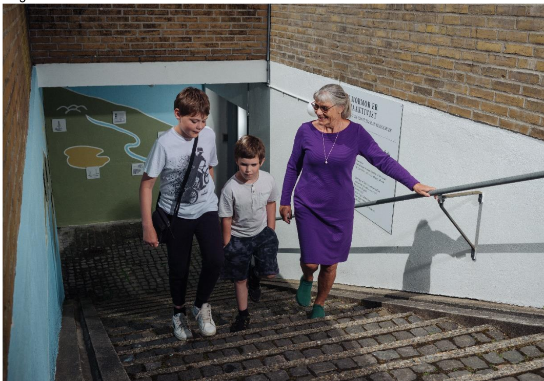
Min mormor er klimaaktivist, Randbøl Sogns Lokalarkiv og Museum

I samarbejde med Randbøl Sogns Lokalarkiv og Museum udviklede udvalget en ny udstilling i Vandel om landsbyer og klima: "Min mormor er klimaaktivist"