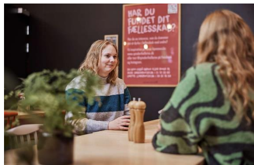
Café arrangement for unge

Alle leder efter en kur, som kan knække den stigende mistrivsel hos unge. Flere retter øjnene mod Vejle Kommunes initiativer og i 2023 er der igangsat et helhedsorienteret projekt, som skal mindske ensomhed og mistrivsel hos unge. Afdelingen Sundhedsfremme og Forebyggelse har i flere år afprøvet forskellige initiativer, der skal fremme den mentale sundhed. Eksempler er kurset "Lær at tackle angst og depression", mentorordningen "UngeAssistenterne" og flere caféer for unge, der står i en sårbar situation.