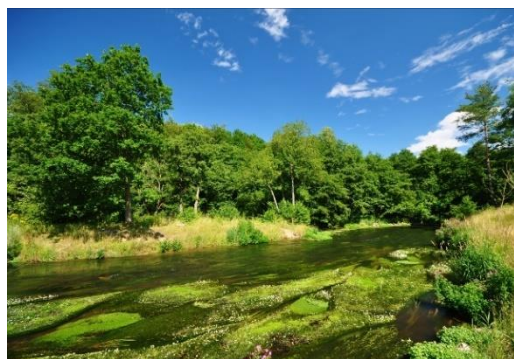
Stryg i vandløb ved Vingsted