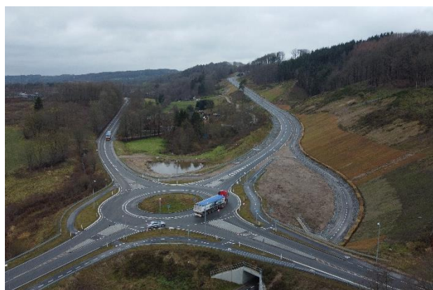
Forbindelsesvej vest om Uhre

Der er arbejdet med analyser af ringvej nord og syd om Vejle samt Havneruten. Analyserne har inddraget interne og eksterne ressourcer og fagligheder, for at sikre de eventuelle fremtidige veje tilpasses og planlægges i forhold til en lang række elementer som natur, klima, miljø og støj. Arbejdet forventes afsluttet i løbet af 2024.