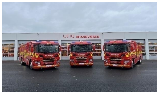
De tre første autosprøjter til henholdsvis Bredsten, Egtved og Vejle