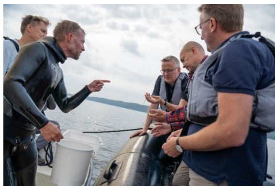
Ministerbesøg – projekt "Sund Vejle Fjord"

Projektet "Sund Vejle Fjord" har medvirket til at sætte et øget nationalt fokus på behovet for genopretning af de marine økosystemer. Samtidig arbejdes der med at formulere næste projektfase med et godt samarbejde med Velux Fonden. Som en udløber af "Sund Vejle Fjord" og i samarbejde med landbrugserhvervet og Syddansk Universitet er der iværksat et måleprogram med henblik på kortlægning af kilder til kvælstofudledning (oplandsanalysen).