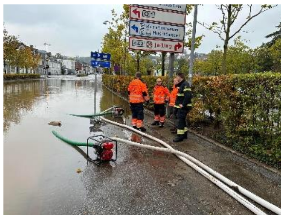
Fotos af de frivillige i forskellige situationer

Målet om at etablere en frivilligenhed hos Vejle Brandvæsen er ligeledes lykkedes. Der var et mål om, at der skulle være 40 frivillige hos Vejle Brandvæsen ved udgangen af 2023. Der er ved udgangen af 2023 41 frivillige, og der er flere, der har givet tilsagn om at blive en del af frivillig- enheden hos Vejle Brandvæsen.