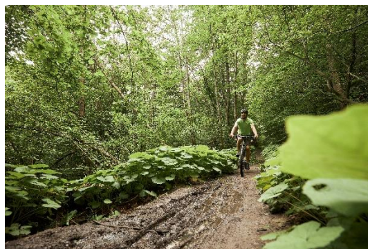
Mountainbike i skoven