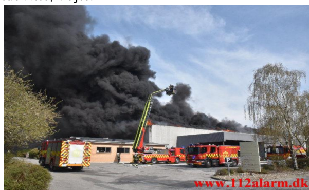
Brand i den gamle margarinefabrik på Solkilde Allé

På det tidspunkt, hvor der var flest brandfolk indsat, var der 64 brandfolk på stedet. Målet med indsatsen lykkedes, hvilket vil sige, at både kontorbygninger, lagre og autoværksted blev reddet. Denne indsats kostede Vejle Brandvæsen isoleret udgifter på 120.000 kr. i lønninger samt tabt og ødelagt materiel.