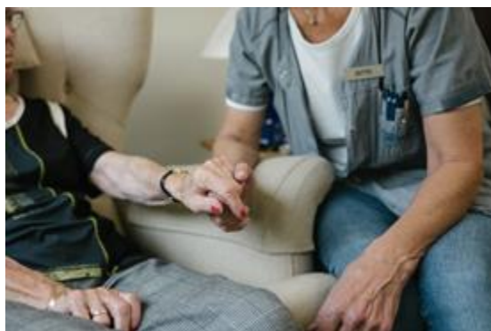
Medarbejder og borger holder i hånden over snak