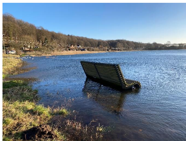
Tirsbæk Strandvej - Høj vandstand (157 cm) under stormfloden Pia den 22. december 2023.

Klimasekretariatet koordinerer Vejle Kommunes klimainsats og holder både Byrådet og Klima-, Natur- og Miljøudvalget opdateret med klima status. Klimasekretariatet har i 2023 arbejdet med proces for evaluering og revidering af fagudvalgenes klimahandlingsplaner i alle fagområder, samt fælles klimahandlingsplan for Vejle Kommune som virksomhed.