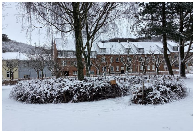
Kvashegn – insekthotel ved Boulevarden – Vardevej, Vejle

Frøblandingen "Vejle Frø", som er sammensat af kommunens naturvejleder og biolog, er sået ud i chikaner blandt andet ved Å-centret og på Toldbodvej i Vejle. Det er besluttet at arbejde videre med lokalt indsamlede frø, som et samarbejde mellem Vej & Park og Natur & Udeliv.