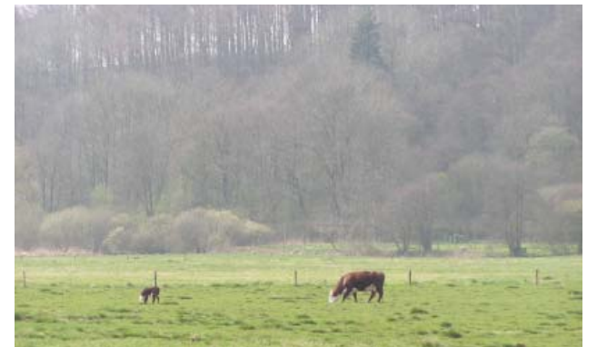
Fotos fra Egtved og omegn: Naturen i Egtved ådal, Museet Højvang, skulptur i Tørskind Grusgrav, interiør fra biblioteket, Vejle Ådal ved Ravnng.