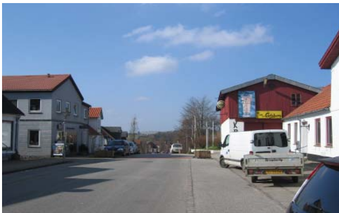
Den tidligere kro