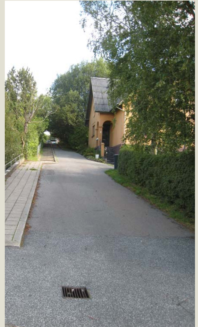
Stejlbjerg set fra syd, med sti til torvet i baggrunden