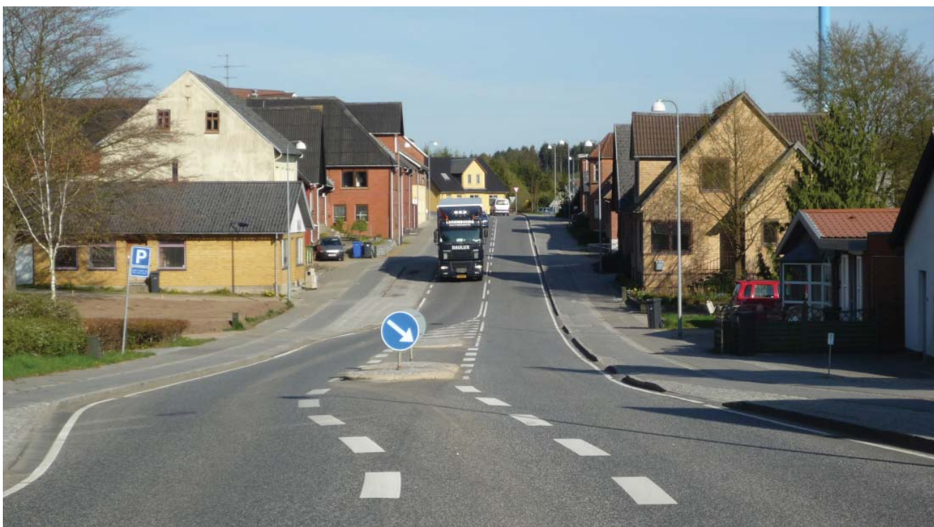
Dalgade set mod øst