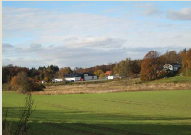
Engområdet set mod øst

Karreens indre har i kraft af det markante terræn en særlig kvalitet, som kan udnyttes bedre end i dag f. eks. ved etablering af infill byggeri og etablering af et offentligt byrum og styrkelse af eksisterende stisystemer. Terrænet giver også nogle begrænsninger især i forhold til tilgængelighed for ældre og gangbesværede.