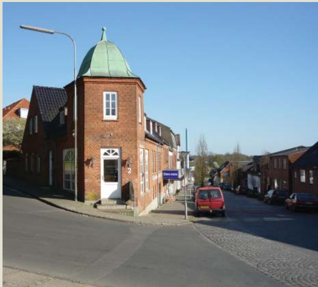
Søndergade set mod øst