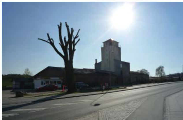
Den gamle foderstof