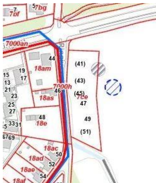
Placering af regnvandsbassin, Ringgivevej, Give