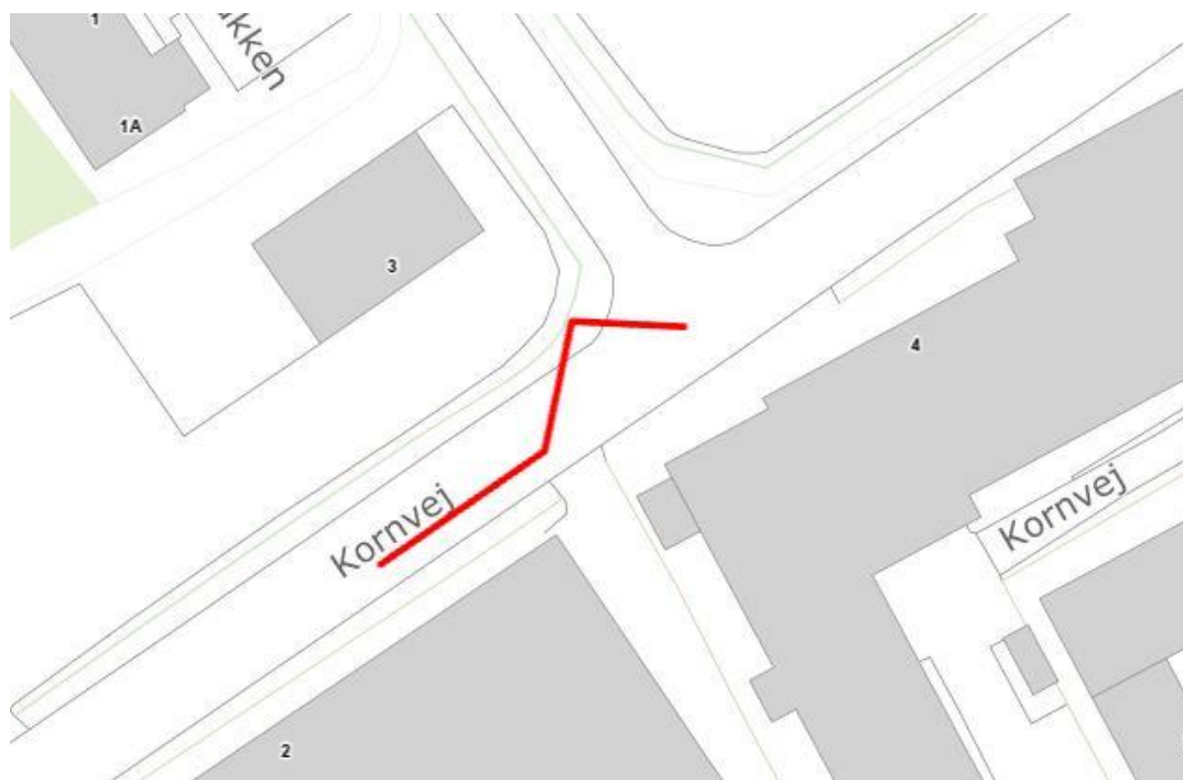
Placering af anlæg på Kornvej 3, Give