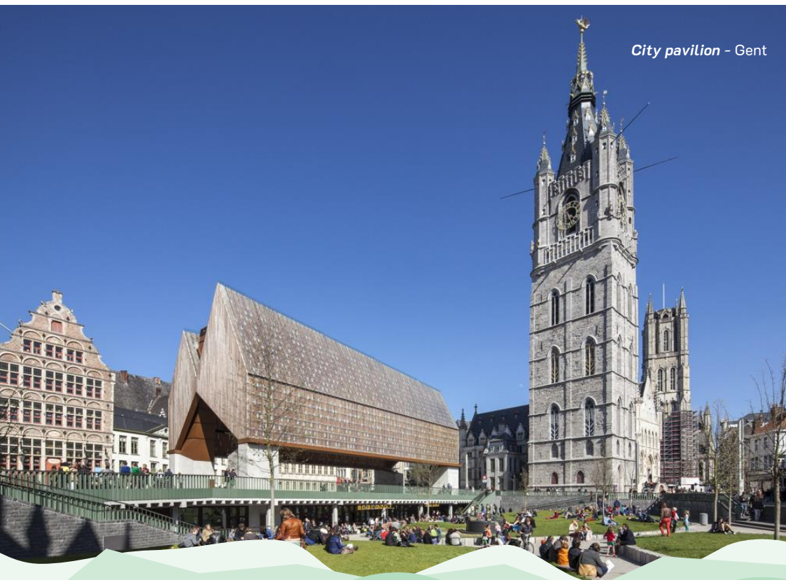
City pavilion - Gent