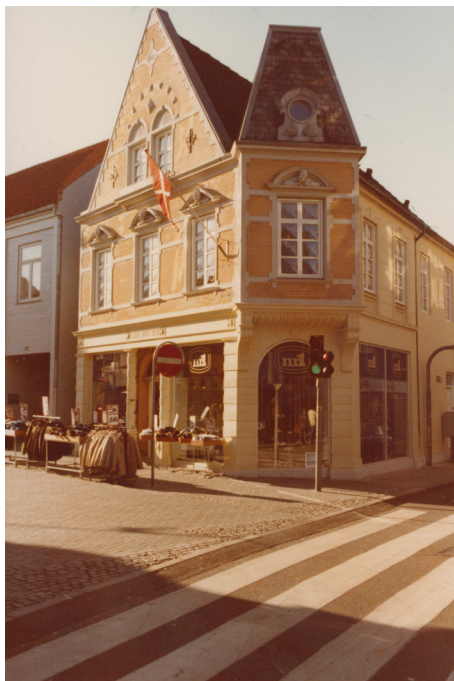
Nørregade 1