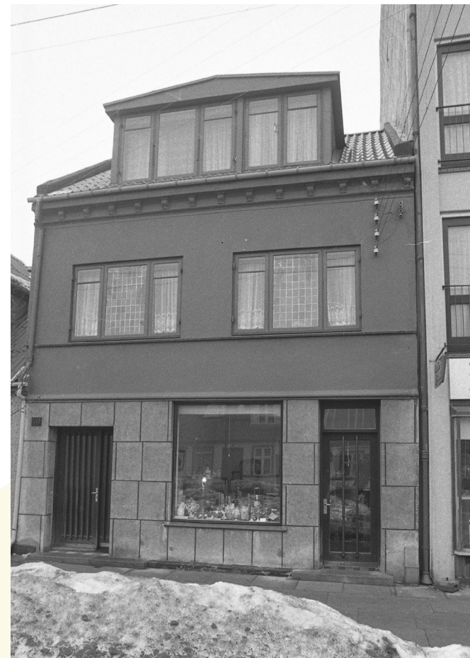
Nørrebrogade 40