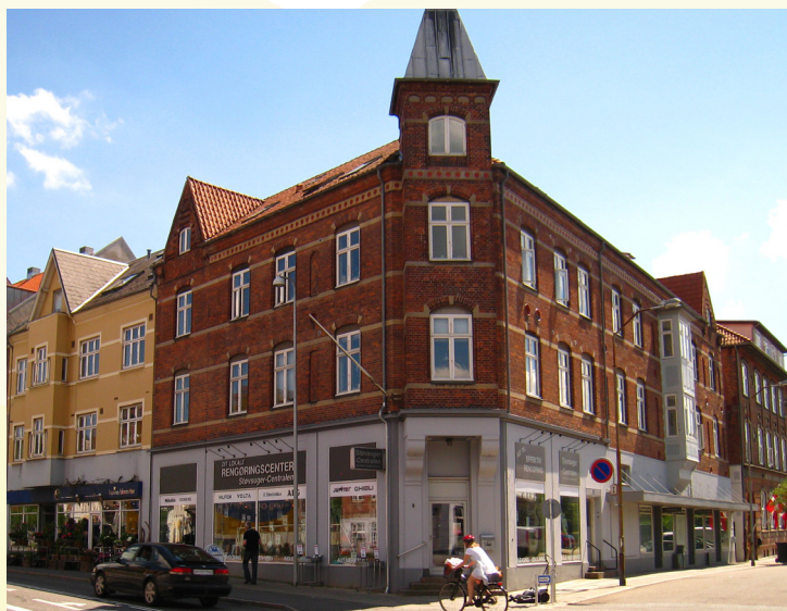
Gormsgade 14-16

Ved gårdrydning, anlæg og beplantning har man skabt et venligt og smukt gårdmiljø.