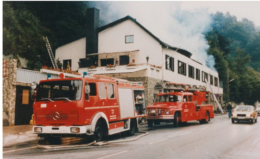
Brand på Vardevej 202 (1979)