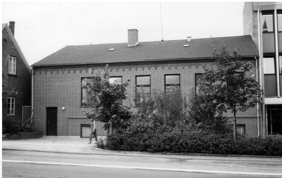
Vejle Taxa