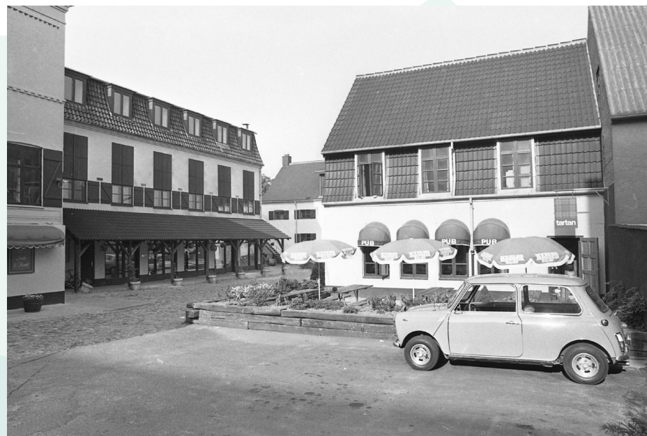
Tartan Pub