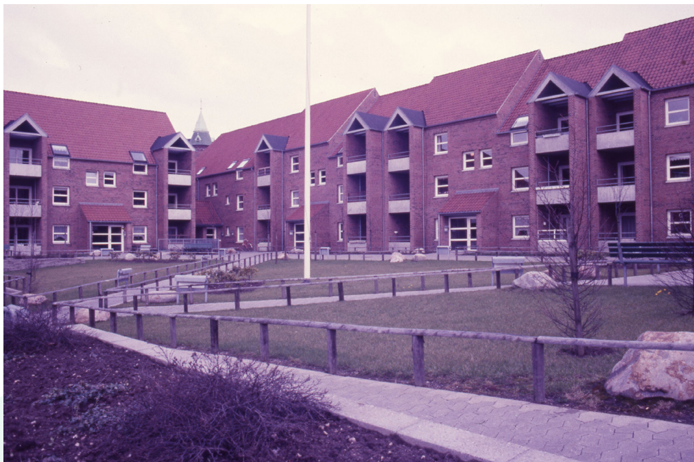
Gårdmiljø - Vejle Stadsarkiv - Fotograf: Teknik & Miljø