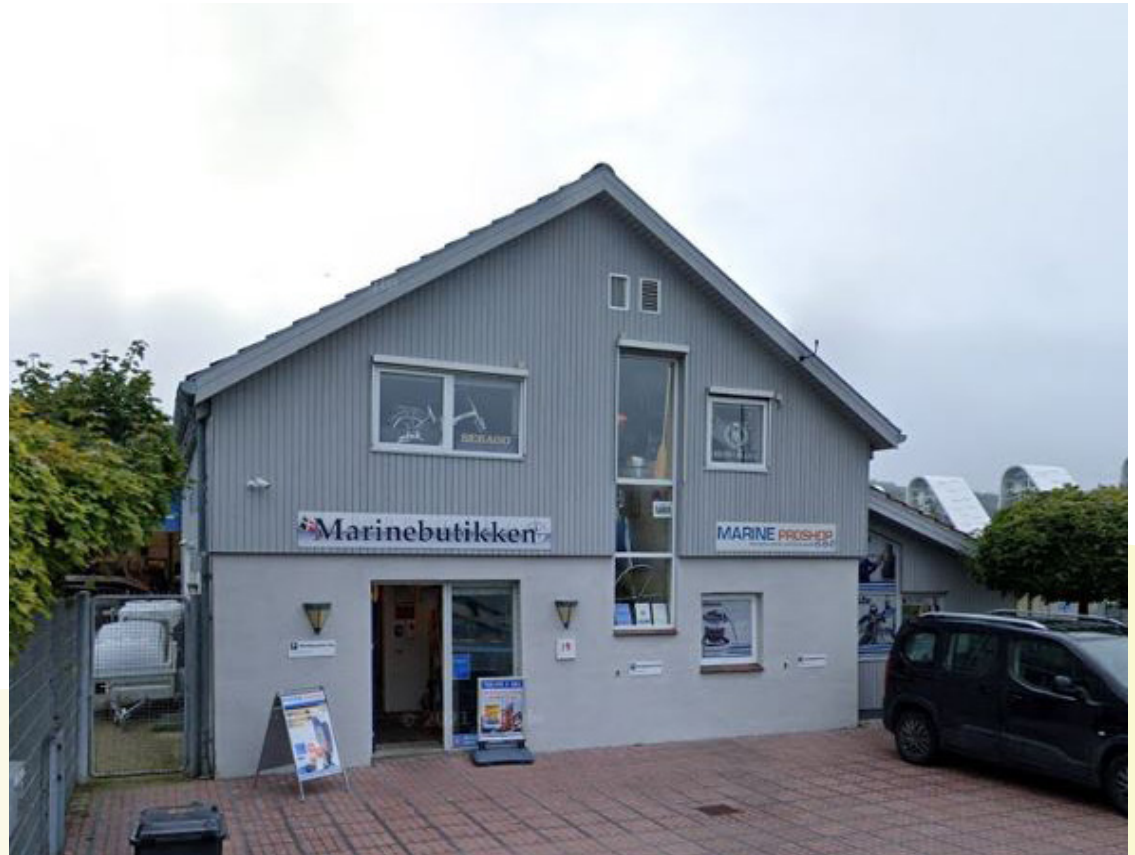
Dyrskuevej 19 - Google Maps 2023