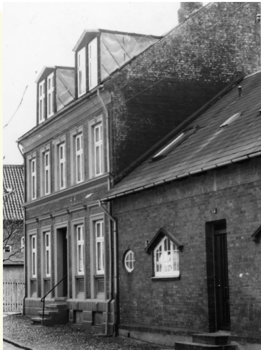
'Nordvestvej 32'

Udført af Lagerarbejder Ejnar M. Nielsen