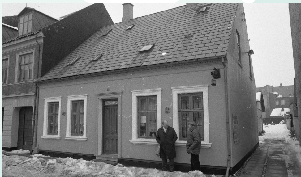
Staldgårdsgade 21

1978 VEJLE PRISEN VEJLE KOMMUNES ARKITEKTURPRIS TILDELES BYGNINGER OG ANLÆG DER ER OPFØRT ELLER RESTAURERET MED ARKITEKTONISK KVALITET