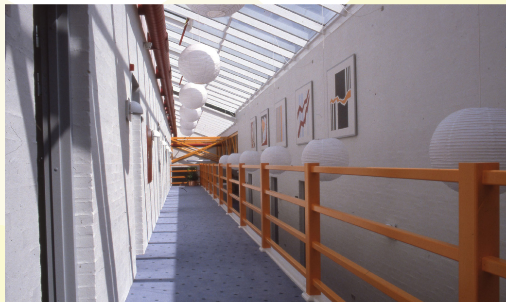
BygningsInteriør - Vejle Stadsarkiv - fotograf: Teknik & Miljø