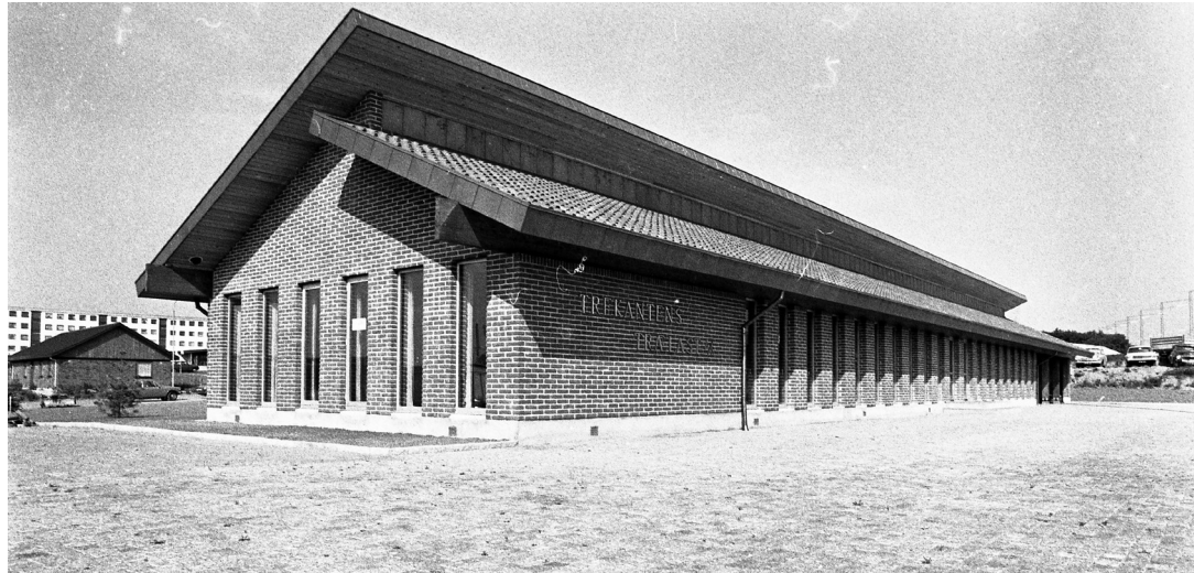
Trekanten Træløst