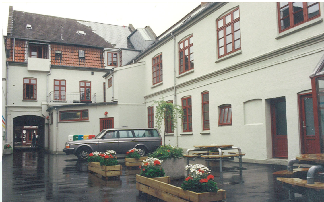
Gårdsmiljø - fotograf: Teknik & Miljø 1989