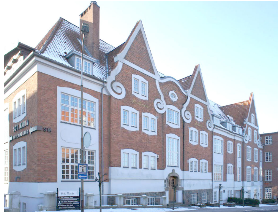
Blegbanken 3 - fotograf: Teknik & Miljø 2006