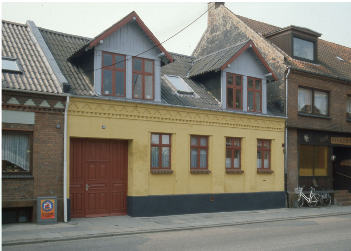
Vesterbrogade 45