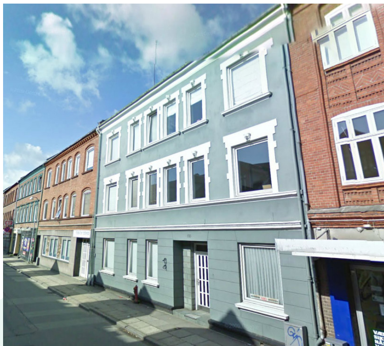
Vedelsgade 103 - 105