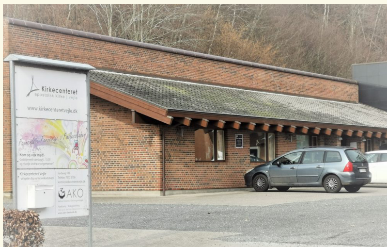
Vardevej 106 (tidl. 104)