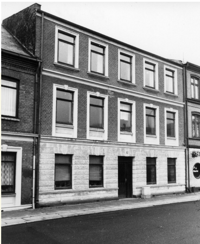
Staldgaardsgade 39

TILDELES BYGNINGER OG ANLÆG DER ER OPFØRT ELLER RESTAURERET MED ARKITEKTONISK KVALITET