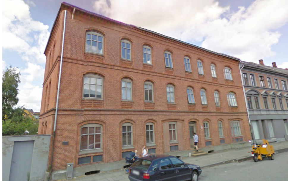
Gormsgade 7 - fotograf: Teknik & Miljø 2006