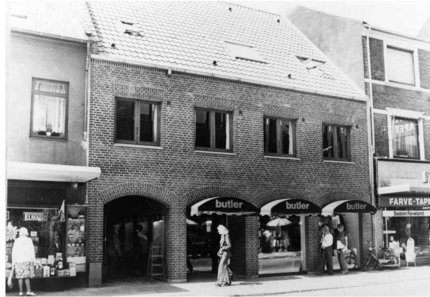
Vestergade 27