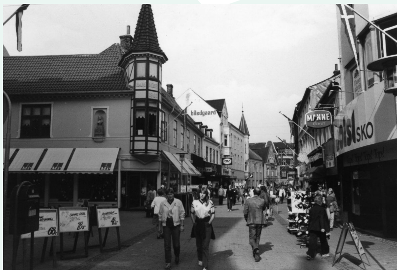
Torvegade 11