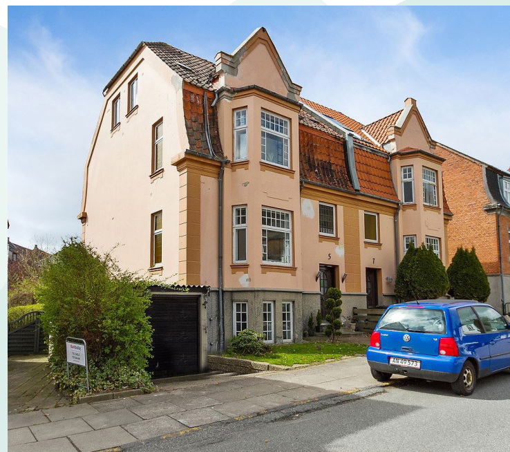
Dalgade 3 og 5