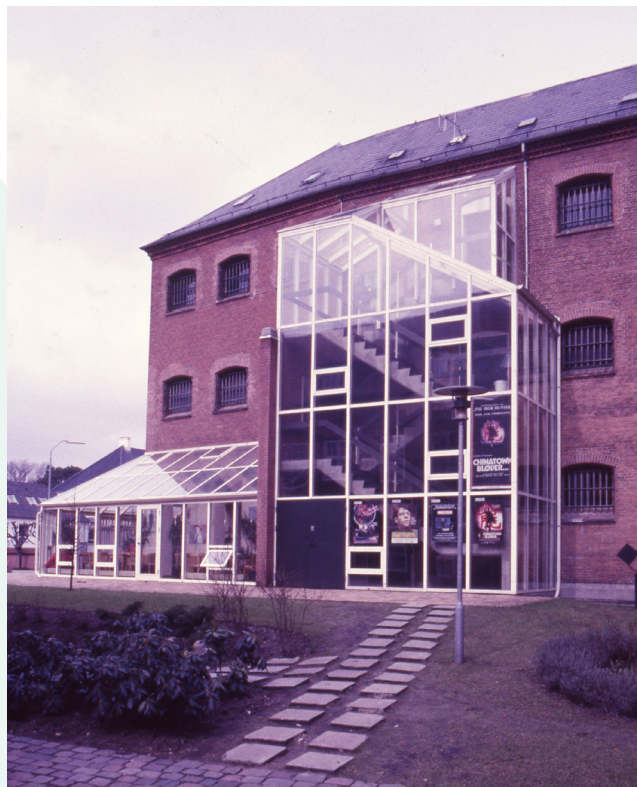
Klostergade 1 - Vejle Stadsarkiv - fotograf: Teknik & Miljø