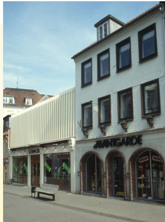
'Torvegade 32'