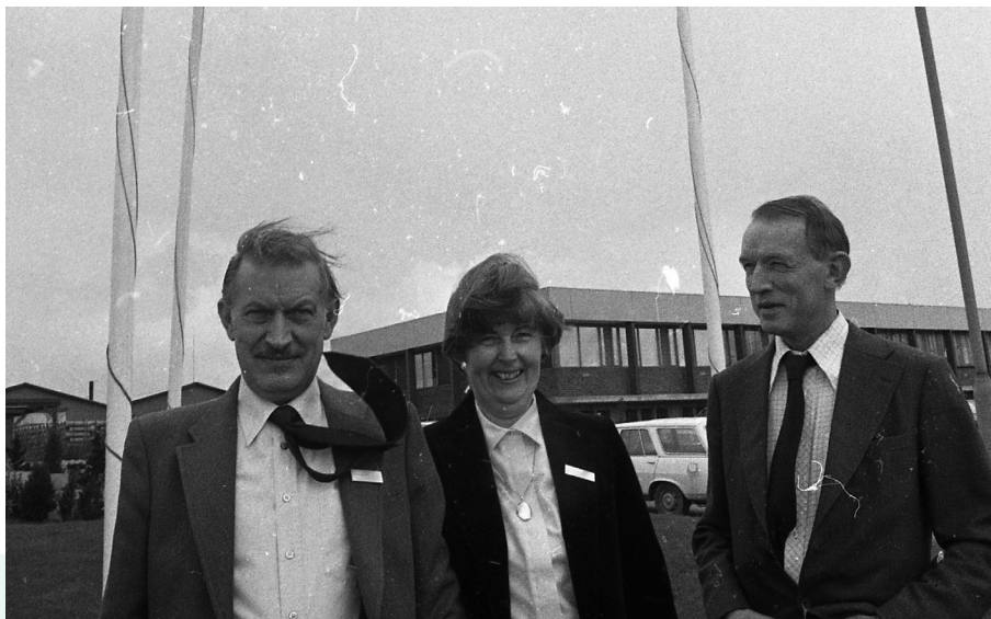
Jubilæum ved VTB på Dandyvej 1-5 - Vejle Stadsarkiv - fotograf: Allan Simonsen