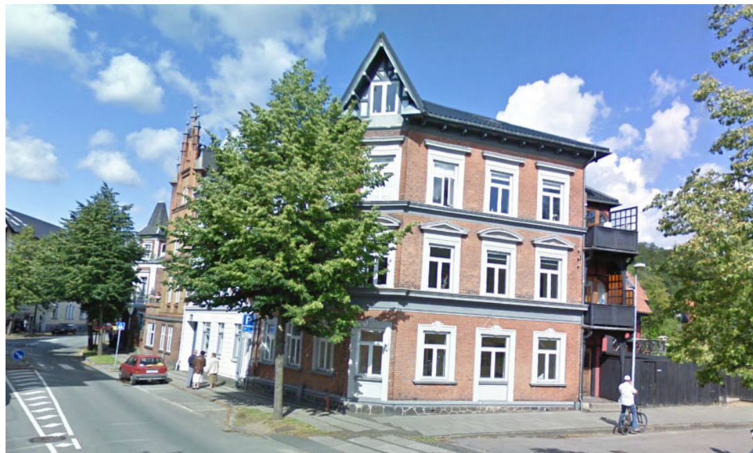
Skyttehusgade/Steensvej - fotograf: Teknik & Miljø 2006