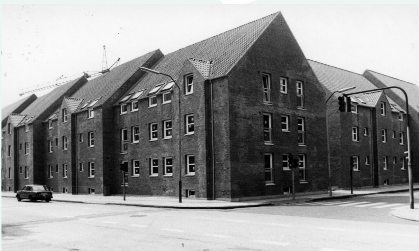
Facaderne mod Nyboesgade og Vedelsgade

Nyboesgade 1 A-C, Vedelsgade 55 A-C og 57 A-D