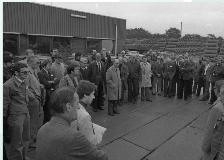
VTB på Dandyvej 1-5