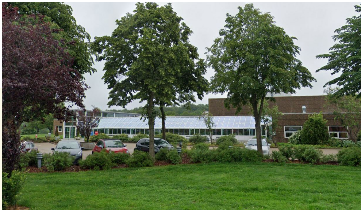
Ulvehavevej 61 - Google Maps 2019

Arkitekt: KPC Totalentreprise A/S Kurt Poulsen, Rådgivende Ingeniørvirksomhed