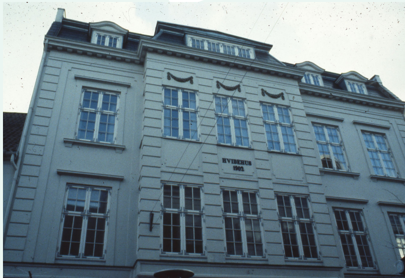
Vedelsgade 36a