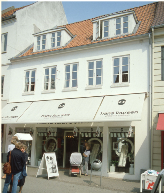
Søndergade 9 - Vejle Stadsarkiv - fotograf: Teknik & Miljø