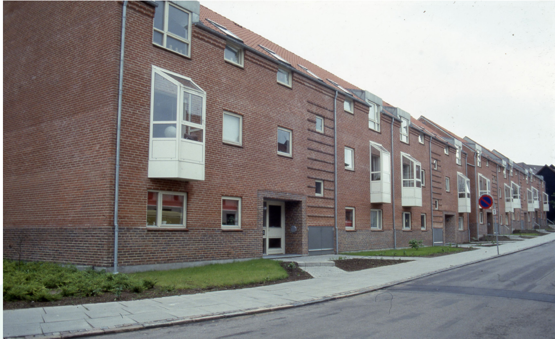
Bleggårdsgade 15 - 23