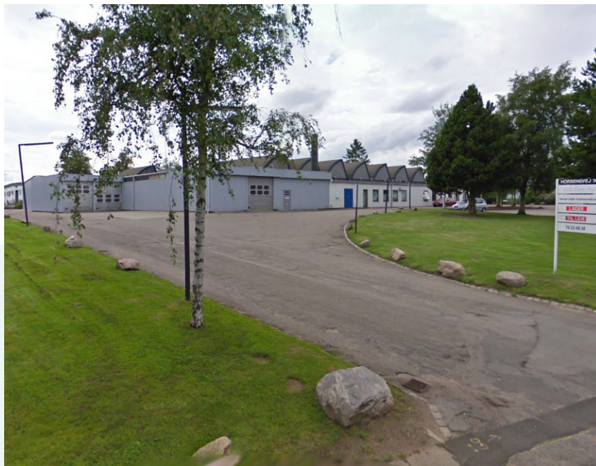
A/S Nordisk Solar Compagni