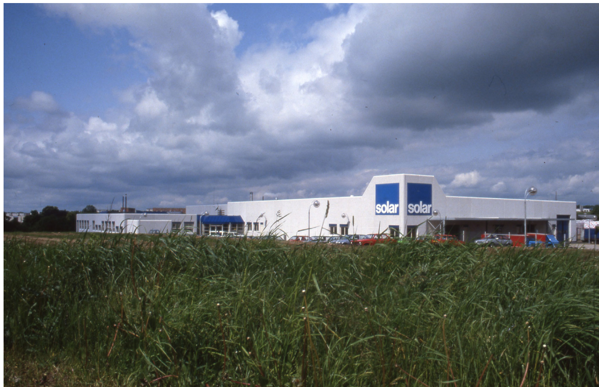
Dandyvej 1 - Vejle Stadsarkiv - fotograf: Teknik & Miljø

Trods bygningskomplekssets store dimensioner, der ofte vil virke kedelig og ensformig, har man her formået at gennemføre et erhvervsbyggeri, der ved materialevalg og bygningsudformning med varierende højder fremtræder på en smuk og spændende måde, præsenteret med den høje beliggenhed i forhold til hovedfærdselsåren, og man har hermed medvirket til byens forskønnelse i området.