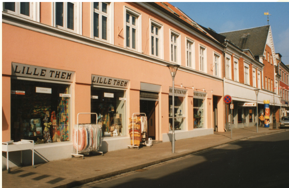
Vestergade 15