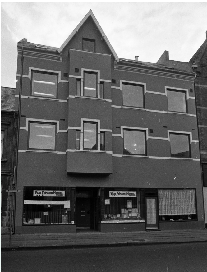
Nørrebrogade 10