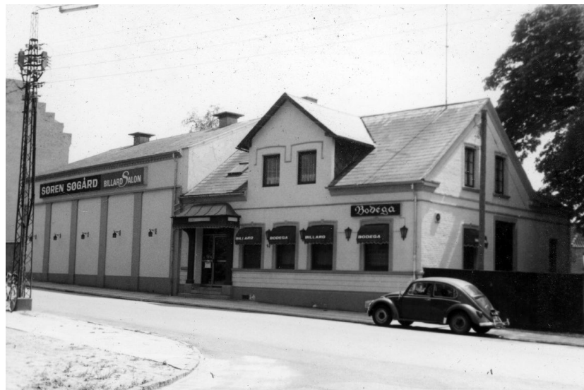
Skyttehusgade 42