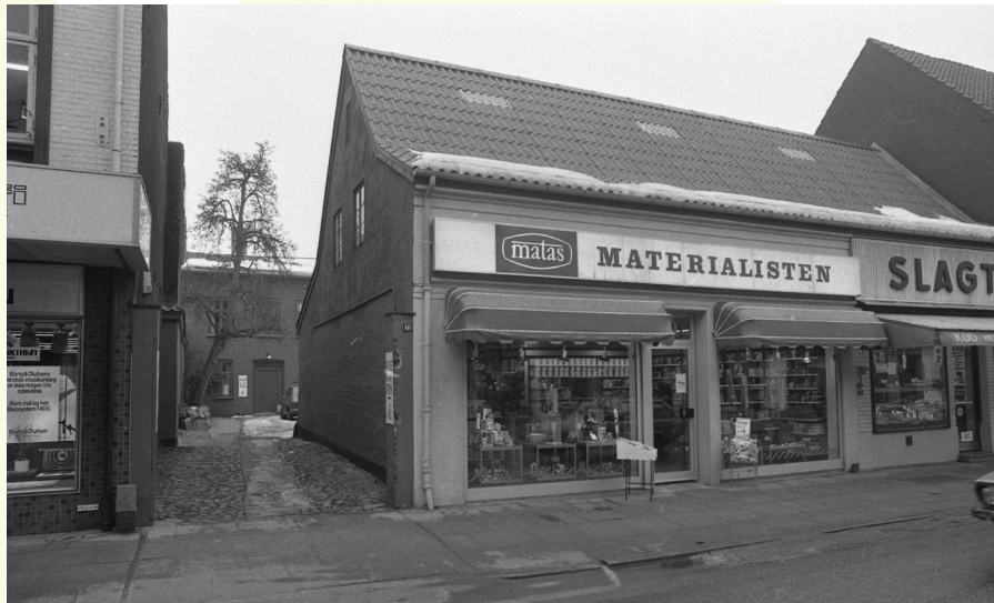
Vestergade 10