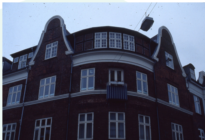
Detajler ved Nørregade/Flegborg