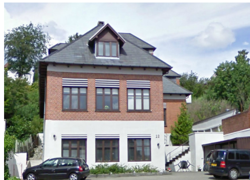
Jellingvej 12 - fotograf: Teknik & Miljø 2006