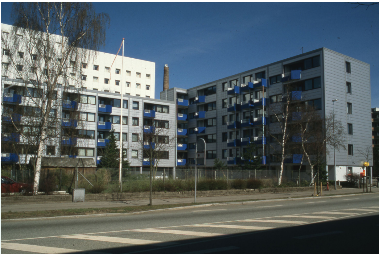
Skovgade 17 m.fl.