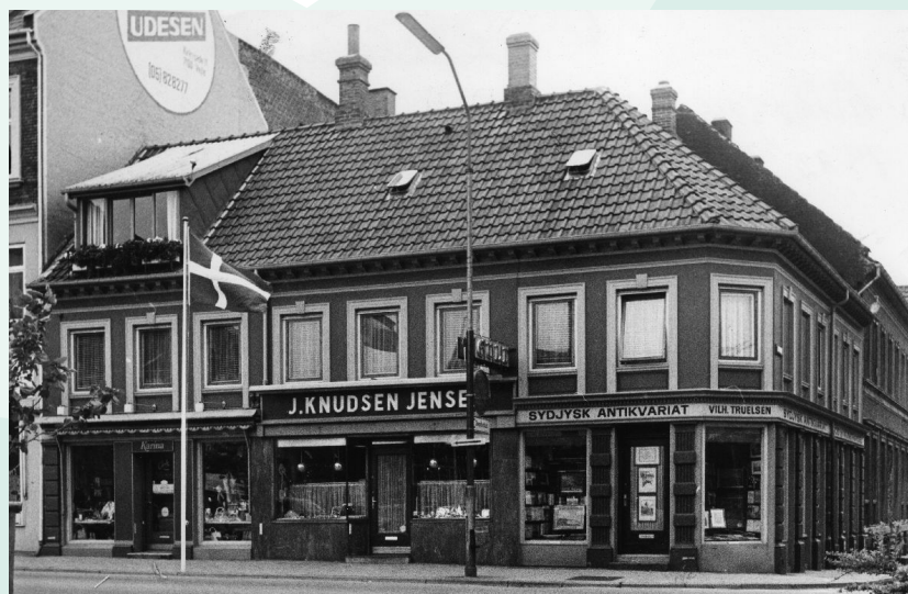
Grønnegade 1 - fotograf: Teknik & Miljø 2006