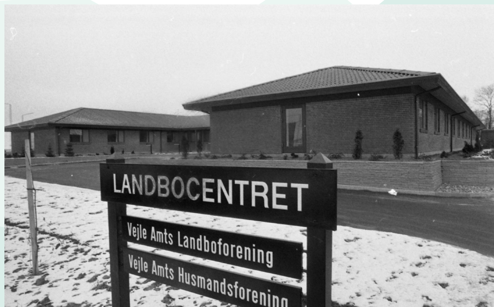
Niels Finsensvej