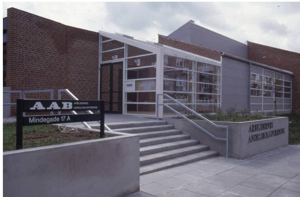
Mindegade 17 a

Arkitekt: Søgaard & Hansen, Arkitekt og Ingeniør- firma A/S