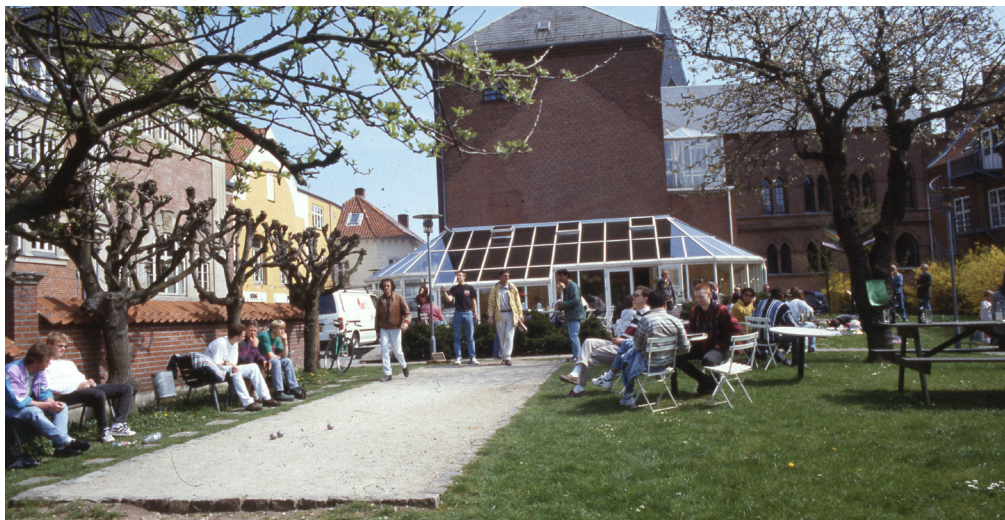
Klostergade 1