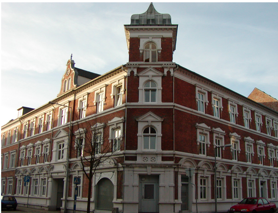
Skyttehusgade 17