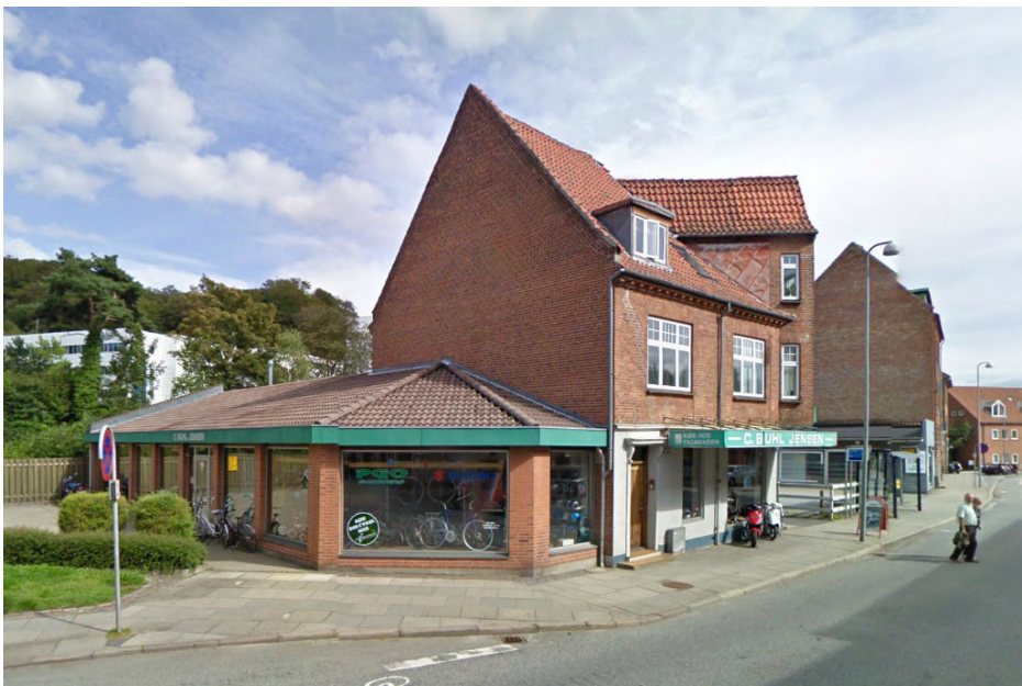
Gormsgade 14-16 - fotograf: Teknik & Miljø 2006