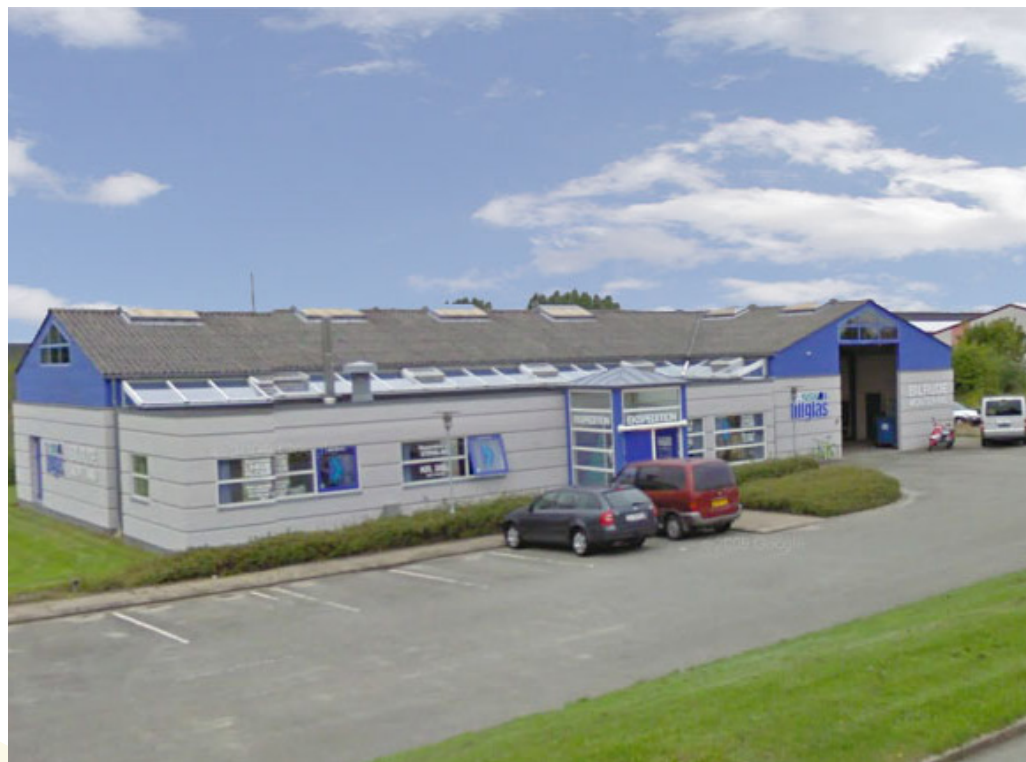
Karetmagervej 8 2006

Bygningen skal fremhæves for det nye og moderne farvesprog, understreget i materialevalg og farvesætning, som et eksempel på, at også mindre erhvervsbygninger kan tilføre området kvaliteter, som medvirker til byens forskønnelse.