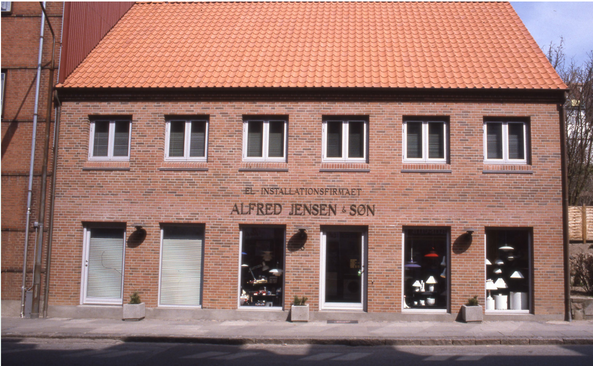
Vardevej 6