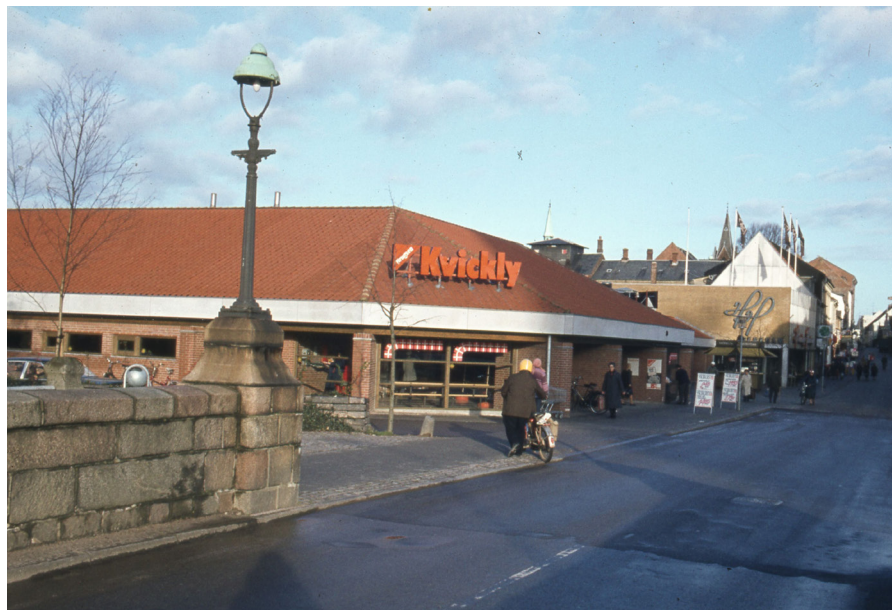
Søndergade 24-26