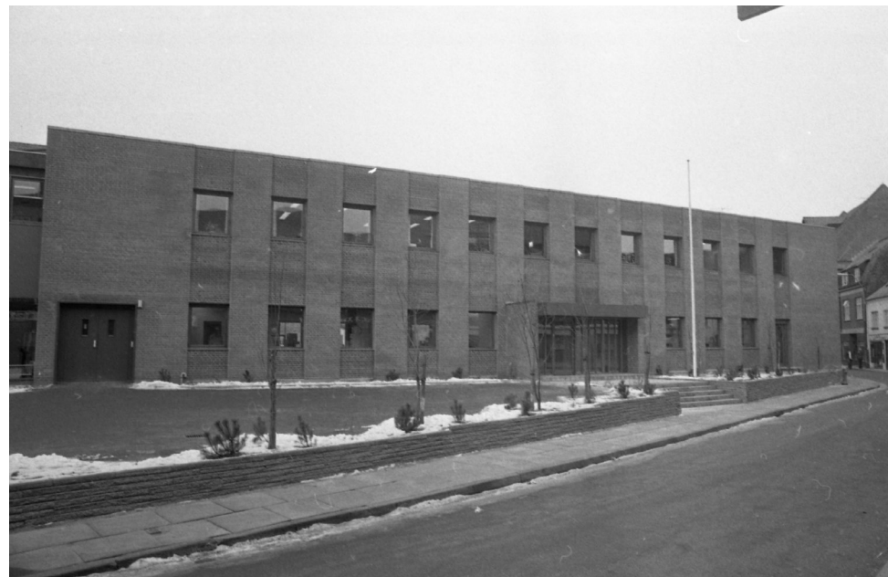
Schweitzers Bogtrykkeri A/S - Vejle Stadsarkiv - fotograf: ukendt