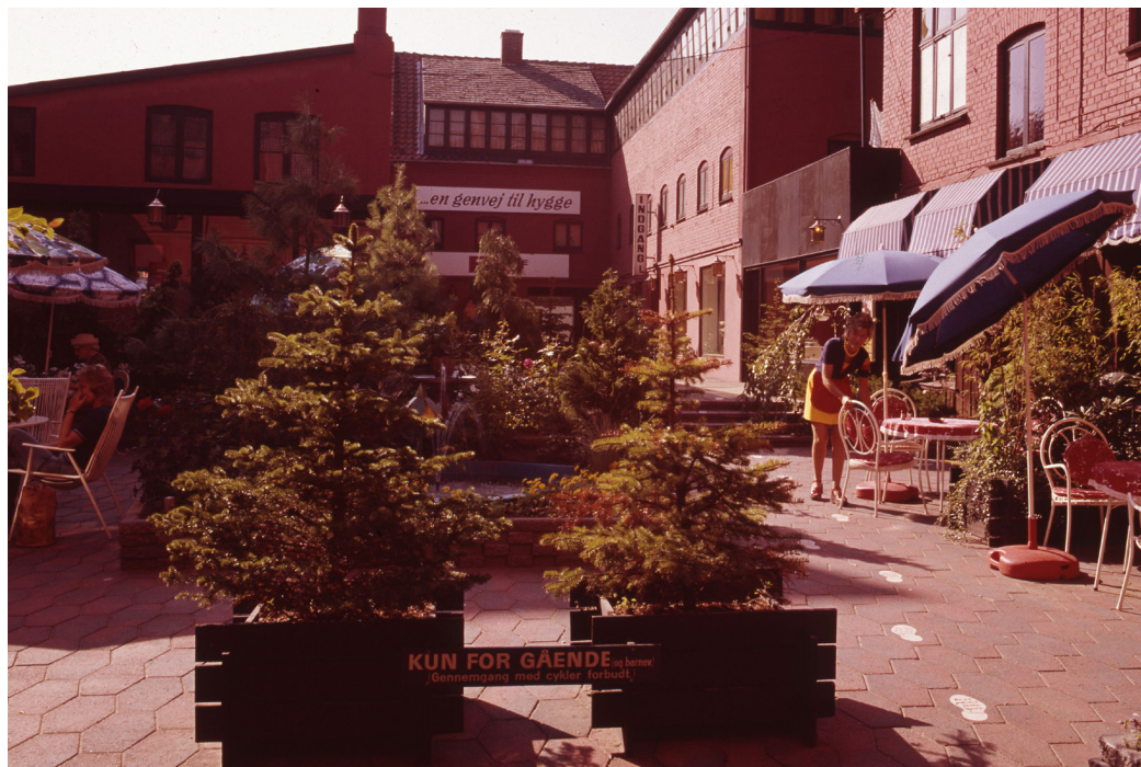
Bo Bedre - Vejle Stadsarkiv, fotograf: Steenberg Reklamefoto