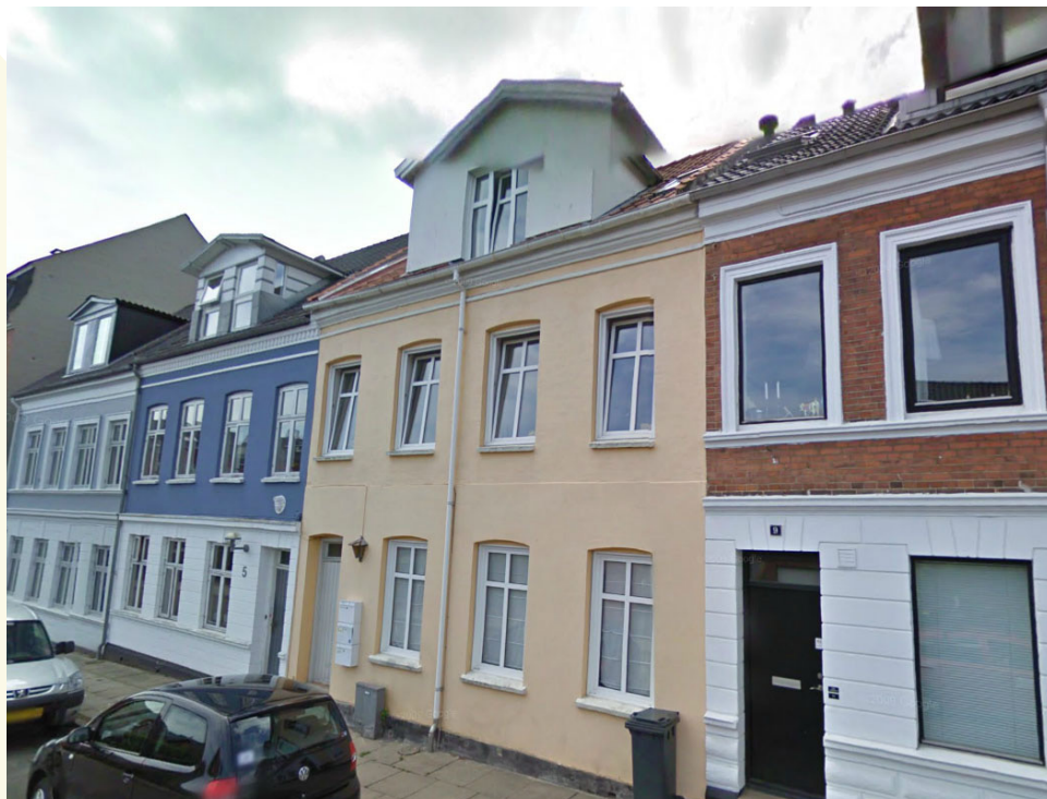
Linnemannsgade 7 - fotograf: Teknik & Miljø 2006