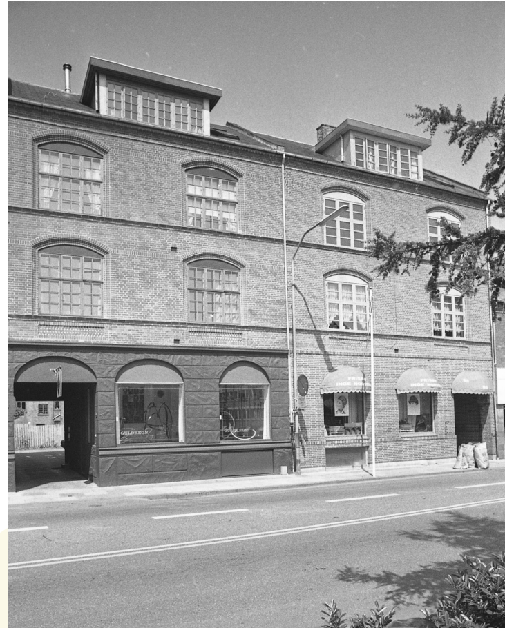
Vedelsgade 63 og 65