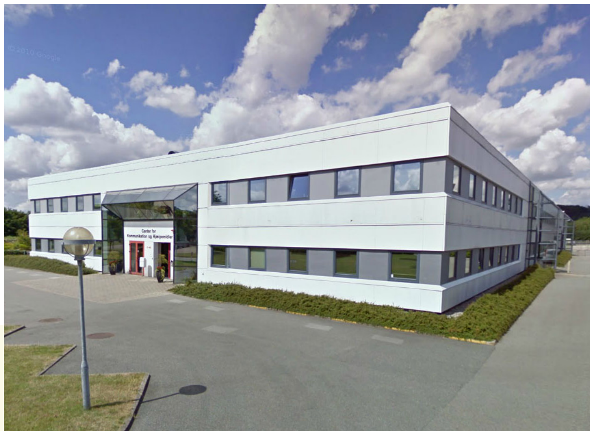
Vestre Engevej 56 2006