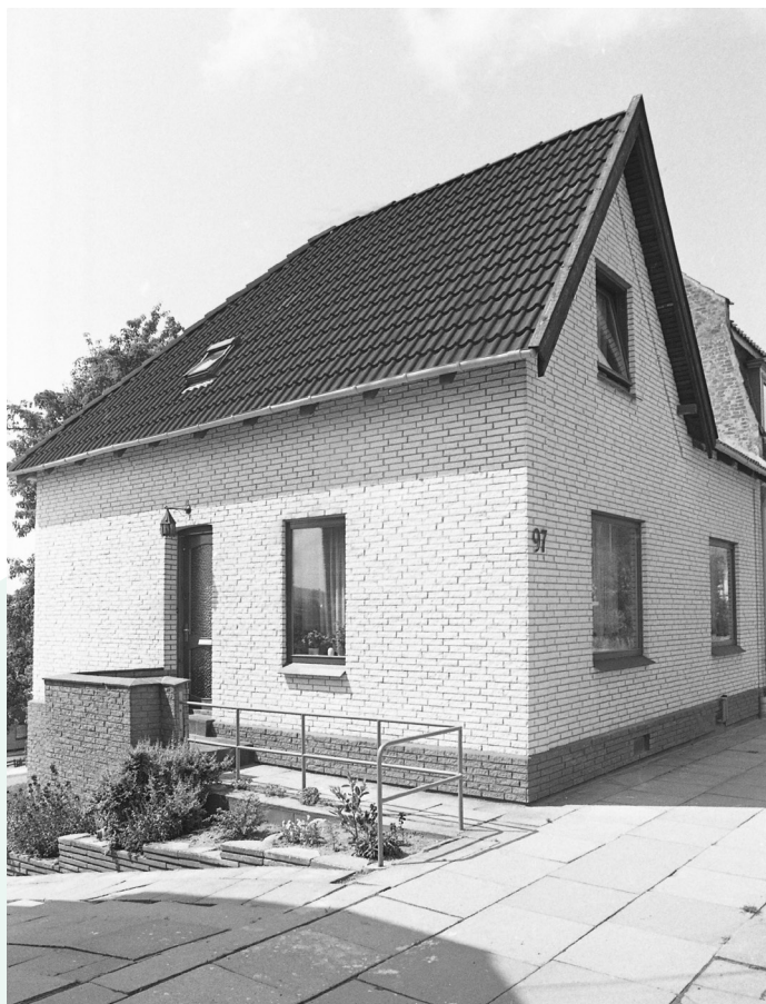
Svendsgade 96