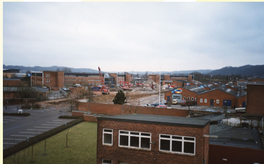
Håndværkerbyen under opførelse