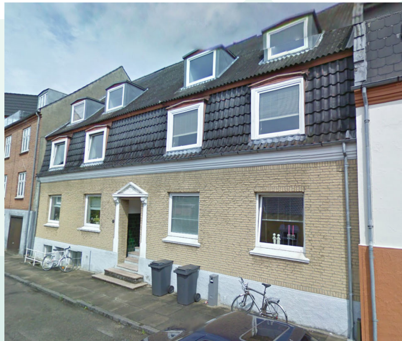
Ved Vandværket - fotograf: Teknik & Miljø 2006