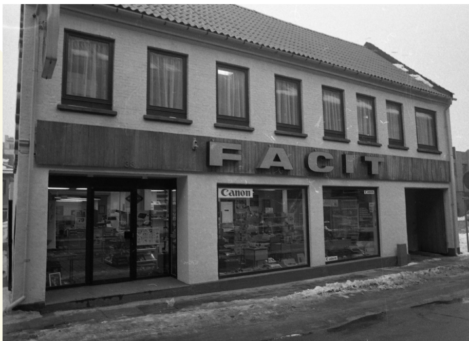
Grønnegade 33