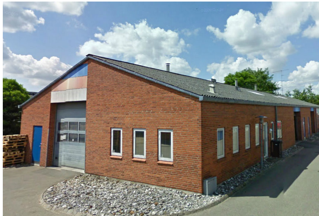
Flegmade 9 - 11