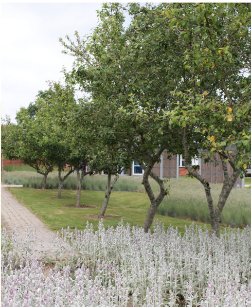
Syrenparken - Børkop

Byggeriet og de fælles friarealer fremstår smukt og poetisk. Materialerne og de cirkulære former giver byggeriet en lethed og et fokus mod haven. De halvcirkulære brusekabiner, som stikker ud fra facaden giver sammen med gennemsigtige skærme af trælister foran adgangspassagen en fin privathed ved indgangen til boligerne. Listemotivet går igen i en delvis overdækning af det cirkulære gårdrum. Haven er et afskærmet rum med blomster og fine muligheder for ophold.