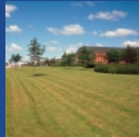
6 TRE-FOR, Lanciavej. Hegn mod vejen med slyngplanter.