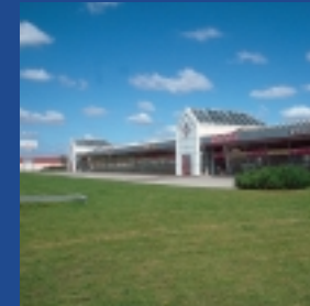
8 Toyota. Facade mod Fredericiavej.